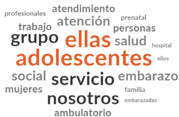
Figura 2. Nube de palabras (NVivo- QSR International MA, USA). Campinas, São Paulo, Brasil, 2017.

Se elaboraron tres categorías temáticas emergentes de los discursos de los profesionales y de las evidencias en la literatura sobre servicios de salud para adolescentes y para la atención prenatal: a) análisis integral de las adolescentes en situación de embarazo; b) experiencias profesionales en la atención a las adolescentes embarazadas que evidencian calidad en el servicio; y c) fortalezas y oportunidades del servicio con posibilidades de replicación como modelo asistencial (Figura 3).