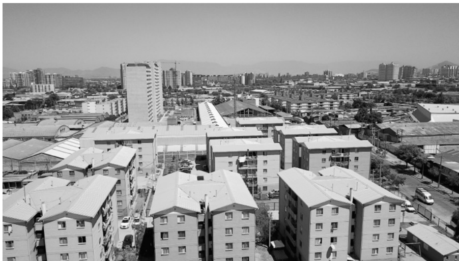
FIGURA 6 Vista aérea, Pacífico Ri