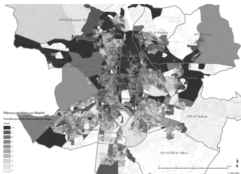
FIGURA 4 Distribución de la renta por tramos en Madrid ELABORACIÓN PROPIA CON DATOS DE EEA, 2017

Los valores de renta de este estudio aparecen detallados geográficamente a la escala de la sección censal. Ello permite una fotografía de la desigualdad urbana en cuestión de ingresos para los hogares de la ciudad de Madrid y establecer comparaciones con las estimaciones de demanda, consumo y precio de la energía realizados en el presente trabajo para la misma escala. En la figura 4 se ha representado el tramo de renta en el que se encuentra cada sección censal.