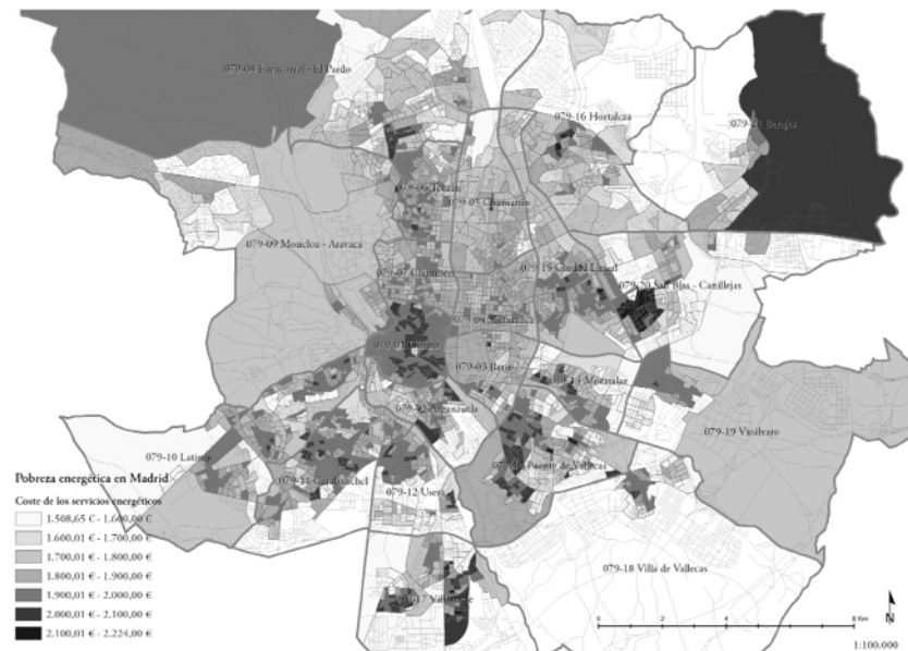
FIGURA 3 Coste anual del consumo energético residencial medio por sección censal ELABORACIÓN PROPIA, 2017

Para la estimación del coste del consumo energético total para todas las viviendas de cada sección censal (figura 3), se ha tenido en cuenta la proporción de viviendas con calefacción eléctrica y gas natural. Las restantes fuentes de energía se han asimilado, de forma simplificada, a la del gas natural.