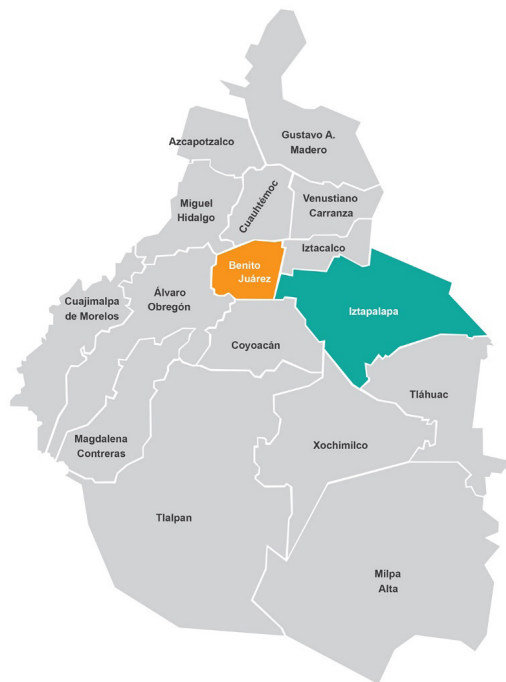
Figura 1. Mapa alcaldías CDMX.

El foco en BJ e Iztapalapa se justifica por su colindancia, disparidad socioeconómica y alta densidad poblacional; punto de especial interés en relación con la pandemia. Si la concentración poblacional propiciaba el contagio, las altas densidades poblacionales se veían problemáticas. Contrastar ambas revelará que la densidad poblacional sólo era un inconveniente cuando se cruzaba con otros factores. Al compararlas no se intenta trazar una linealidad sobre