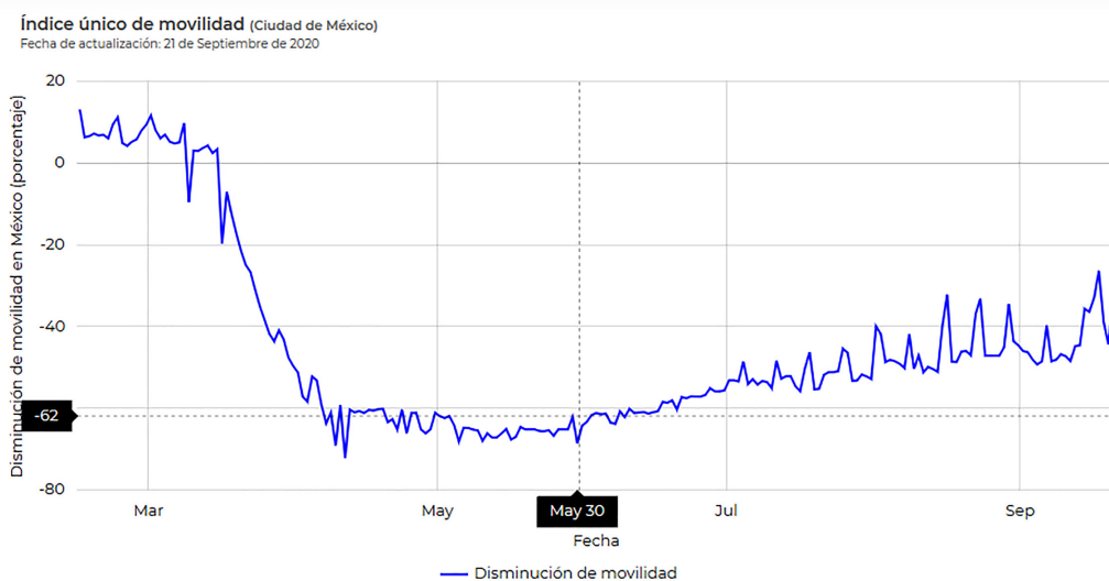
Figura 4. Movilidad en CDMX entre marzo y septiembre de 2020.

Destaca aquí la evidente desigualdad en los rubros identificados por su relación con la muerte por la COVID 19: precariedad y nivel educativo.