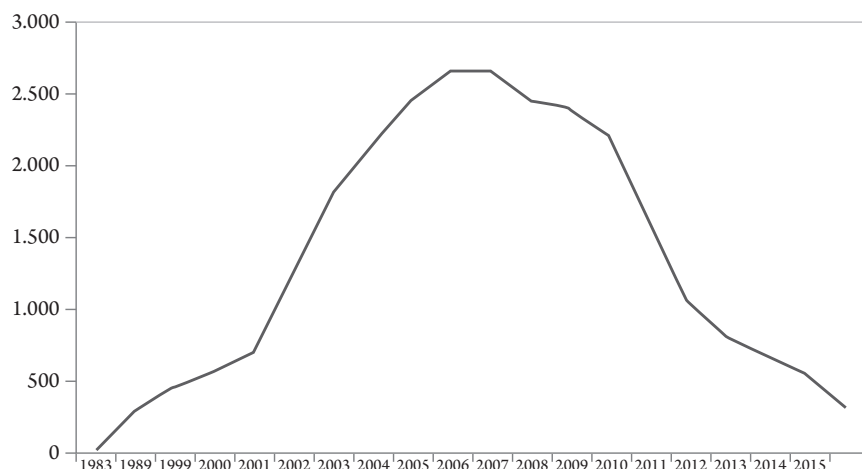
Figura 2. Cooperativas de trabajo asociado en Colombia, 1983-2016

Fuente. Elaboración propia con base en datos de la Superintendencia de la Economía Solidaria.