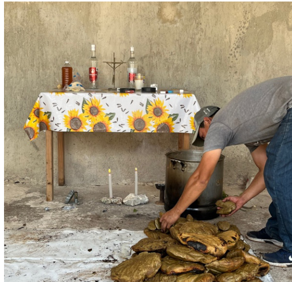
Imagen 2. Preparación de la mesa de jets' lu'um

Una vez envueltos y amarrados, estos panes fueron cocidos en el púib , un proceso que incluyó el previo calentamiento con piedras y la cobertura de los panes con hojas de roble y tierra. Ya cocidos, se sacaron del púib y se distribuyeron en la mesa-altar; otro tanto se deshizo en trozos y migajas para añadirse al ya'ach' . Se ofreció saka' a los invitados y, en la mesa, se colocaron platos de ya'ach' , 16 junto con el k'ool y los pollos sacrificados. Posteriormente, el jmeen reunió a todos dando unas palabras; después se repartió la comida entre los asistentes.