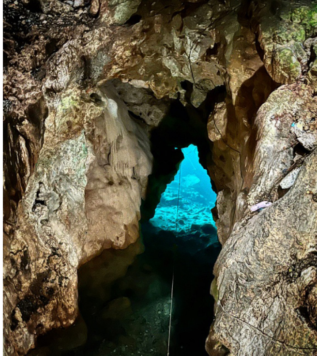
Imagen 4. Uno de tantos cenotes que se encuentran en Homún

igualmente capacitados para testificar sobre la existencia de ese orden, lo que despersonaliza las discusiones. Por ello, nadie cuestiona ni refuta lo que otro dice, ya que el foco no está en las personas, sino en la colectividad y el reconocimiento compartido de un orden del mundo.