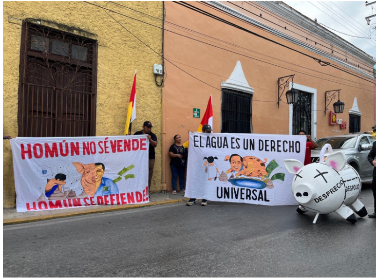
Imagen 1. Kanan Ts'ono'ot frente a la SDS