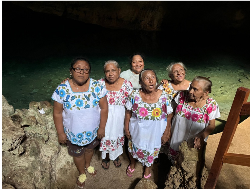
Imagen 3. Mujeres de Homún participantes en el jets' lu'um