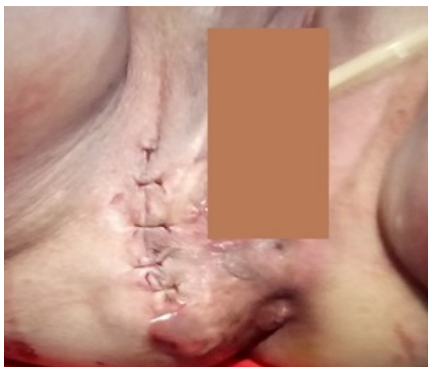
Figura 4. Cierre de la piel con sutura absorbible