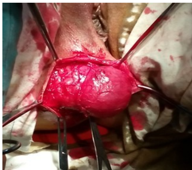
Figura 2. Saco herniario disecado