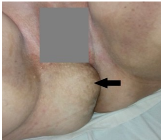
Figura 1. Hernia visible en región perineal posterior derecha

Se cerró la piel con cromado 2-0, el postoperatorio inmediato transcurrió sin complicaciones con una estadía hospitalaria de tres días luego de lo cual se egresó y se dio seguimiento posquirúrgico de un año, sin evidencias de recidiva ni sintomatología (figura 4).