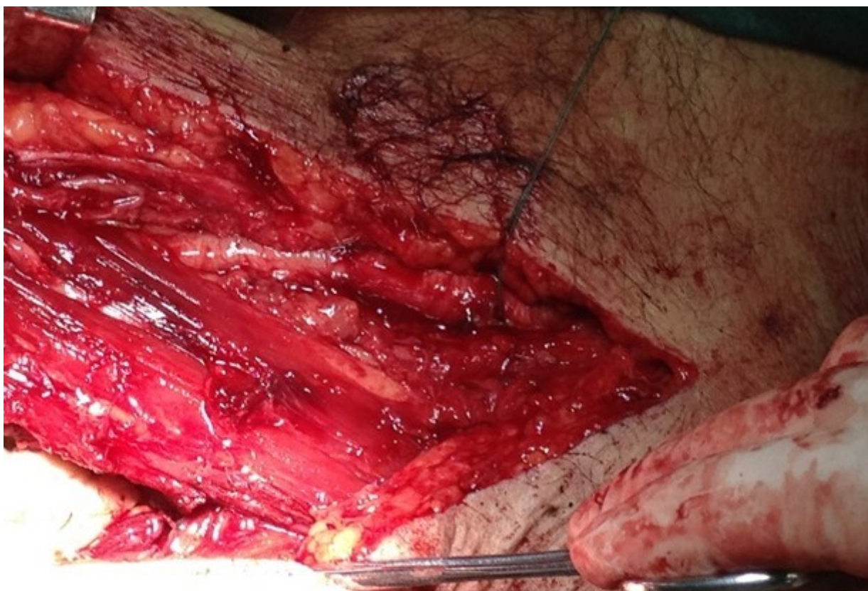
Figura 5. Control arterial proximal para evitar el sangramiento tras-operatorio durante la resección de la metástasis ósea

En los tumores óseos metastásicos de las extremidades con gran tamaño y muy vascularizados resulta útil el control vascular proximal, que disminuye de manera significativa el sangrado durante la cirugía y así facilita una resección más efectiva (figura 5).