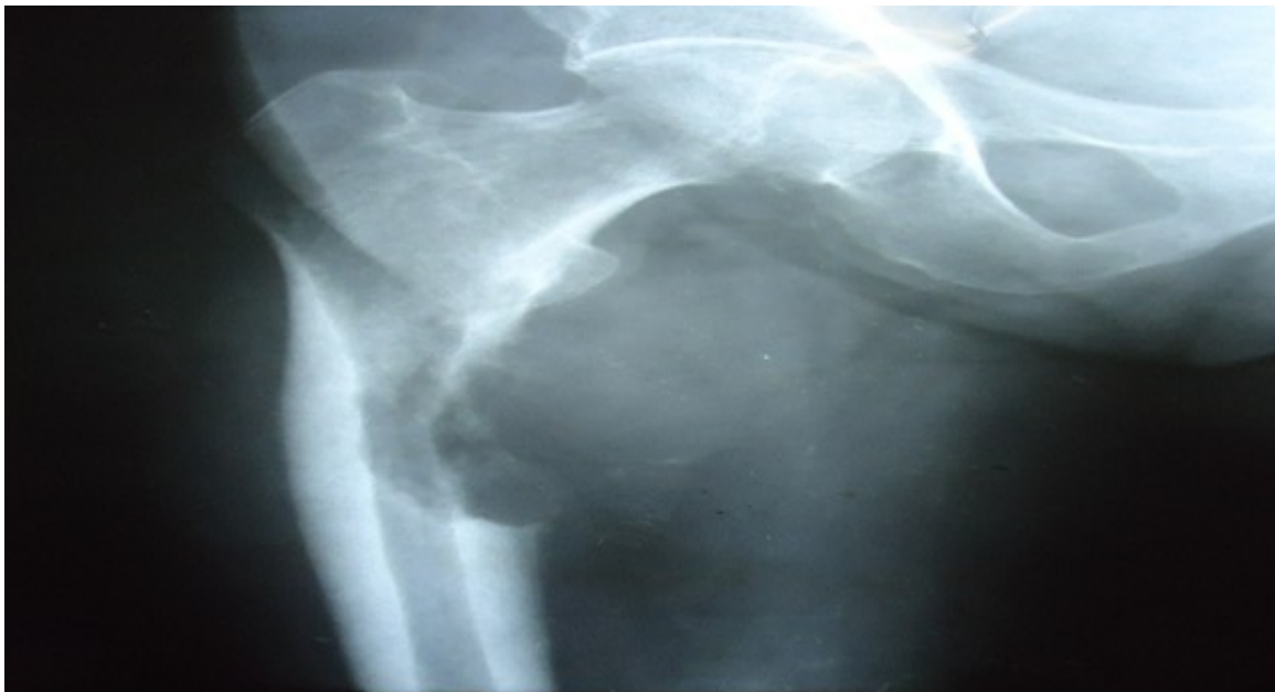
Figura 2. Imagen metastásica de carcinoma de pulmón en el fémur derecho con riesgo de fractura patológica, 11 puntos según la puntuación de Mirel H. 28

Debido a que el aspecto más importante es la detección precoz del paciente con riesgo de FP,