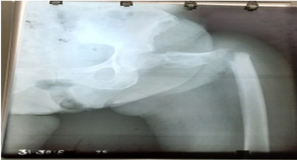
Figura 1. Paciente de 81 años de edad, femenina, que sufre fractura patológica en el área subtrocantérica, diagnosticada hace diez años de cáncer cervico-uterino, dolor previo en la zona antes de la fractura interpretado como una cialgia y trauma mínimo por un mecanismo de torsión frente a su cocina.

radiológico transversal y presencia de enfermedad previa local o sistémica (figura 2). 25-27