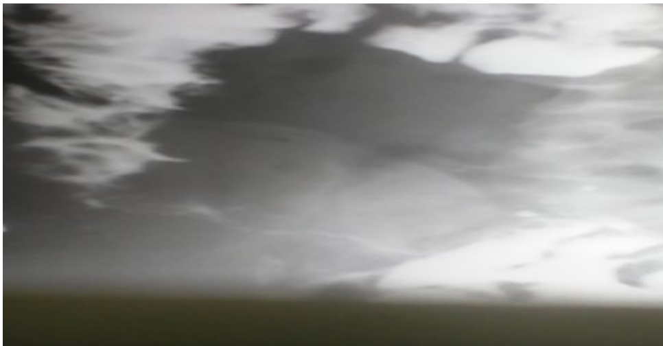
Figura 2. Tránsito intestinal: se observa amplia zona de estenosis, regular, cerca de tres cm de largo, en proyección del ileon distal.

Se realizó endoscopia digestiva inferior con el objetivo de acceder al íleon terminal y tomar muestras de biopsia. La mucosa de intestino grueso hasta la válvula ileocecal de características normales con estenosis a ese nivel que no permitió el acceso al íleon terminal a pesar de múltiples maniobras. Se tomaron muestras de región cecal para estudio histopatológico que informaron hiperplasia linfóide de ciego.