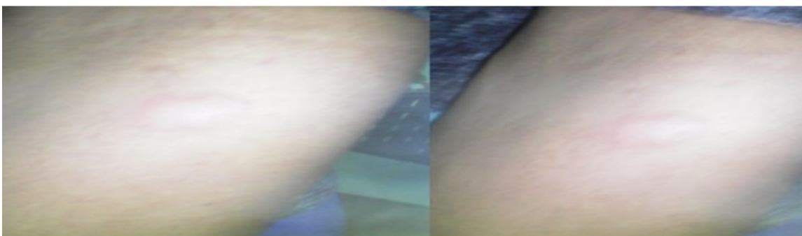
Figura 4. Prueba de la tuberculina. La lectura se realizó a las 72 horas, se leyó solo la induración del diámetro máximo transversal al eje mayor del brazo y fue de 13 mm, con presencia de microflictenas en los bordes de la pápula.

Se llevó a cabo mediante inyección intradérmica de 0,1 ml de derivado proteico purificado (DPP). La inyección se realizó en cara anterior de antebrazo, al mantener la piel tensa. La lectura se realizó a las 72 horas, se leyó solo la induración del diámetro máximo transversal al eje mayor del brazo y fue de 13 mm, con presencia de microflictenas en los bordes de la pápula (Figura 4).