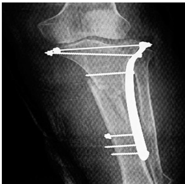
Figura 3. Paciente a los tres meses de operada, obsérvese extensión completa de la rodilla afectada y flexión de 80 grados.

En la actualidad realiza las actividades habituales antes de sufrir el accidente, con consolidación de las fracturas (Figura 4).