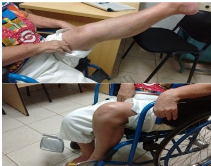
Figura 4. Paciente a los nueve meses incorporada a su vida normal, rango de movimiento normal y consolidación de las fracturas a los seis meses de operada.