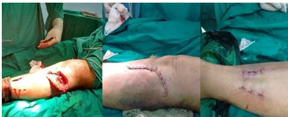
Figura 2. Abordajes quirúrgicos empleados, para la colocación de la lámina y tornillos de 4,5 milímetros.

Una vez en el quirófano, se comenzó con la reducción de la meseta tibial con perno de Web y luego se utilizó lámina subcutánea para tornillos convencionales y bloqueados de 4,5 milímetros, desde la meseta tibial hasta las uniones del tercio medio e inferior de la tibia. El dispositivo de osteosíntesis se colocó a través de dos abordajes quirúrgicos, para evitar toda la exposición de los tercios proximales y distales de la tibia. La reducción fue corroborada mediante fluoroscopia con intensificador de imágenes (Figura 2).