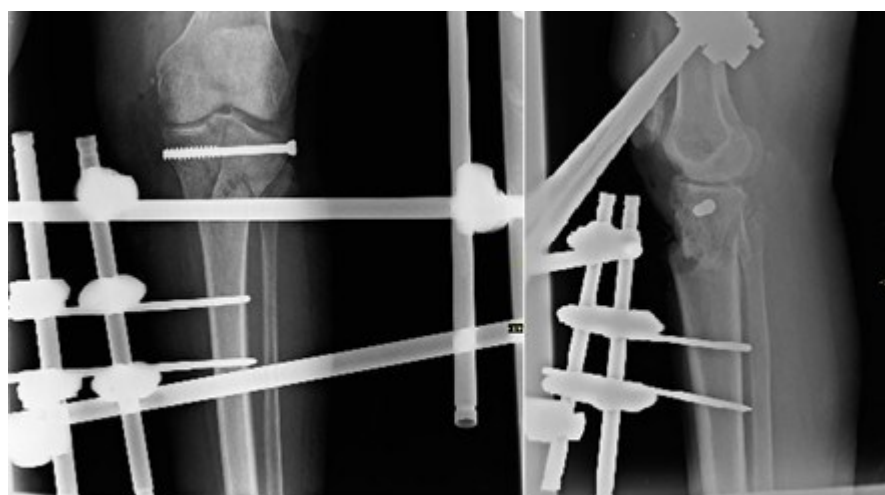
Figura 4. Control radiográfico posoperatorio de la fractura.

La paciente necesitó de injerto de piel, su situación de salud evolucionó de forma satisfactoria y la FE fue retirada a los tres meses y medio cuando se confirmó la presencia de signos de consolidación radiográficos.