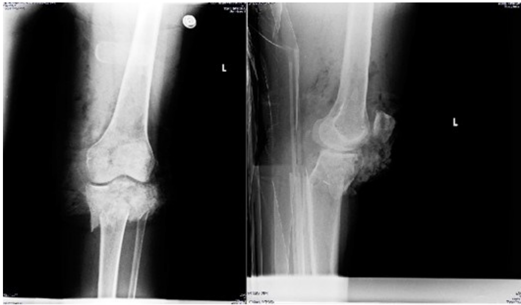
Figura 1. Solución de continuidad del tejido óseo a nivel de la zona metafigo-epifisaria de la tibia proximal izquierda.

Una vez en la sala de Ortopedia se prescribió curas en días alternos y se realizó radiografía de control nuevamente en vistas antero-posterior y lateral (CS-0013359/18) (Figura 4).