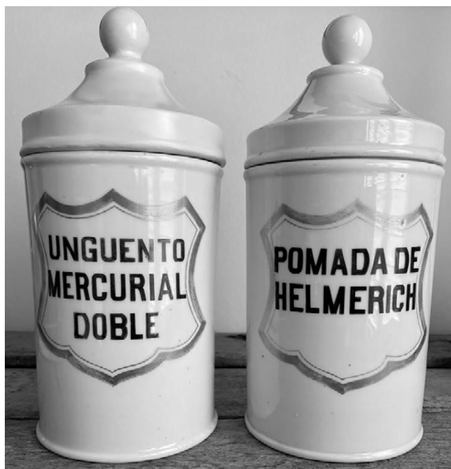
Figura 4. Contenedores de medicamentos del año 1945.

Un diseño simple puede también representar una categoría joven, en un momento histórico determinado; en este caso, el empaque es únicamente un contenedor que permite preservar el producto y tiene una función logística. Es decir, aún no se han establecido códigos de diseño asociados con atributos y beneficios que permiten al consumidor anticipar la experiencia y valor del producto contenido (Bloch, 1995). De esta manera, los diseños simples pueden evocar el momento histórico en el que la categoría surge y el producto es etiquetado con la mínima cantidad de elementos, por ejemplo, aquellos frascos blancos que se encontraban a comienzos de siglo en las farmacias (Figura 4. Contenedores de medicamentos del año 1945). En ese entonces, los productos se marcaban con colores básicos, incluso la publicidad impresa, la televisión o las películas eran en blanco y negro (Greenleaf, 2011).