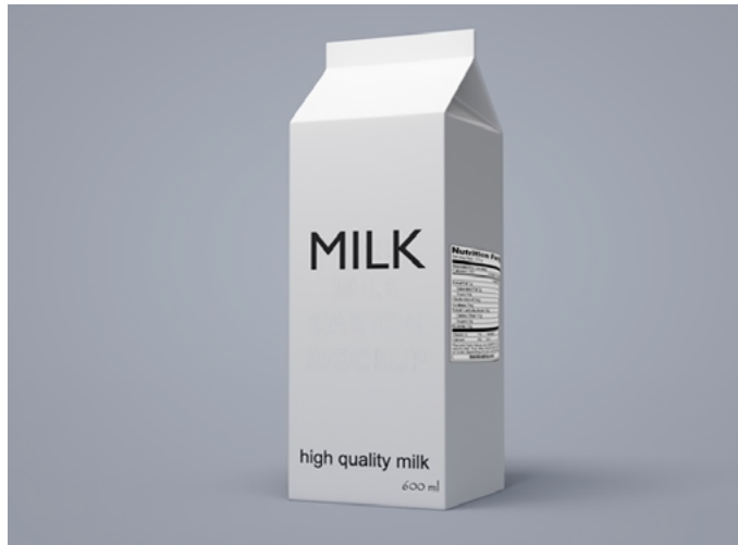
Figura 1. Empaque simple.

manera voluntaria. Por su participación, recibieron un pequeño obsequio (llavero plástico). La edad de los participantes varió entre 19 y 55 años; 43% de ellos se reconoce como hombre y 57% se reconoce como mujer; 72,2% de los participantes declaró ser consumidor habitual de leche, mientras que un 27,8% dijo sí consumir leche, sin ser un consumidor habitual.