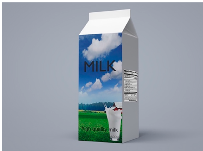
Figura 2. Empaque complejo.