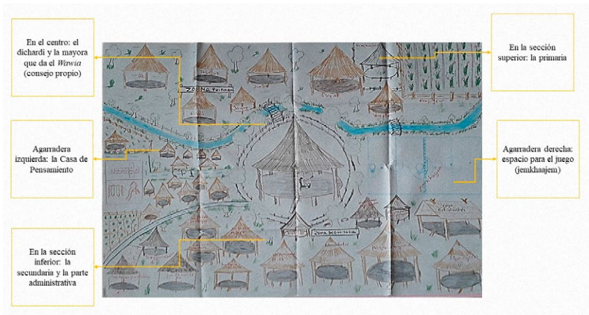
Figura 1. Plano del colegio wounaan imaginado por sus autoridades