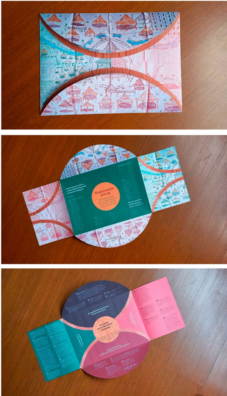
Figura 4. Plegable