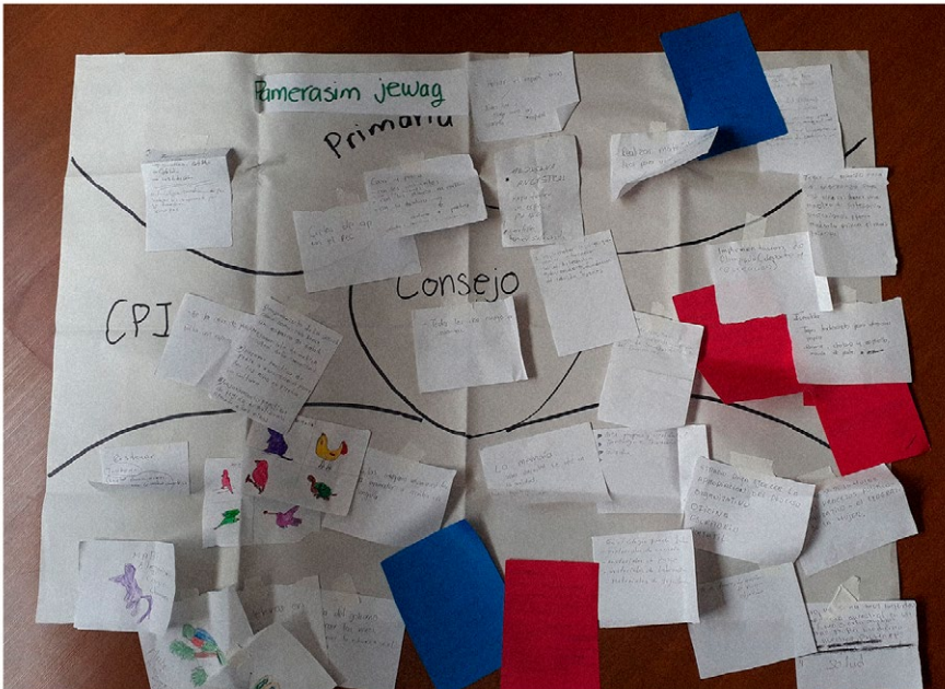
Figura 3. Cartelera final de recomendaciones

En el corazón del plano del colegio imaginado está dibujado el dichardi (centro de reuniones culturales y políticas) y una mayora arrodillada tejendo, quien cumple la