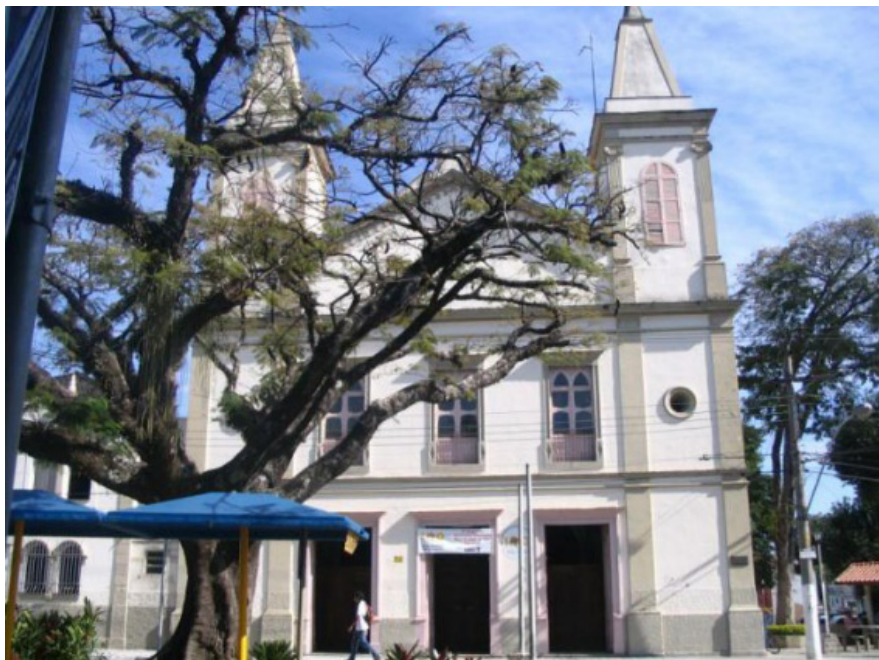
FIGURA 1: A igreja de Nossa Senhora do Rosário de Taubaté

Nota: A Igreja de Nossa Senhora do Rosário de Taubaté mantém ainda a estrutura original com paredes e abóbada em madeira e taipa de pilão - 2007.