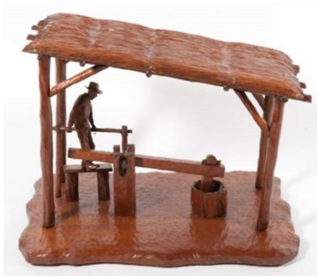
Figura 11 – A. Tacci. Maquete de monjolo de pé (1954). Acervo do Museu Paulista.