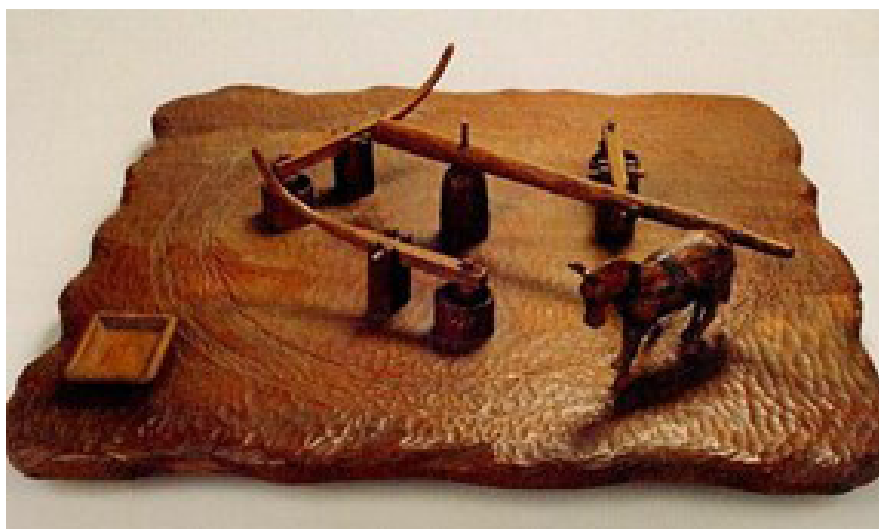
Figura 12 – A. Tacci. Maquete de monjolo de rabo (1954). Acervo do Museu Paulista.