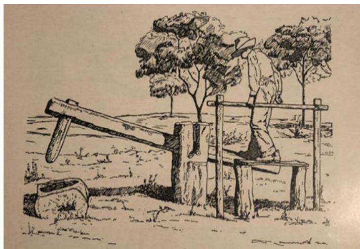
Figura 13 – Osny de Azevedo. Monjolo de pé (s. d.). In Schmidt (1967).