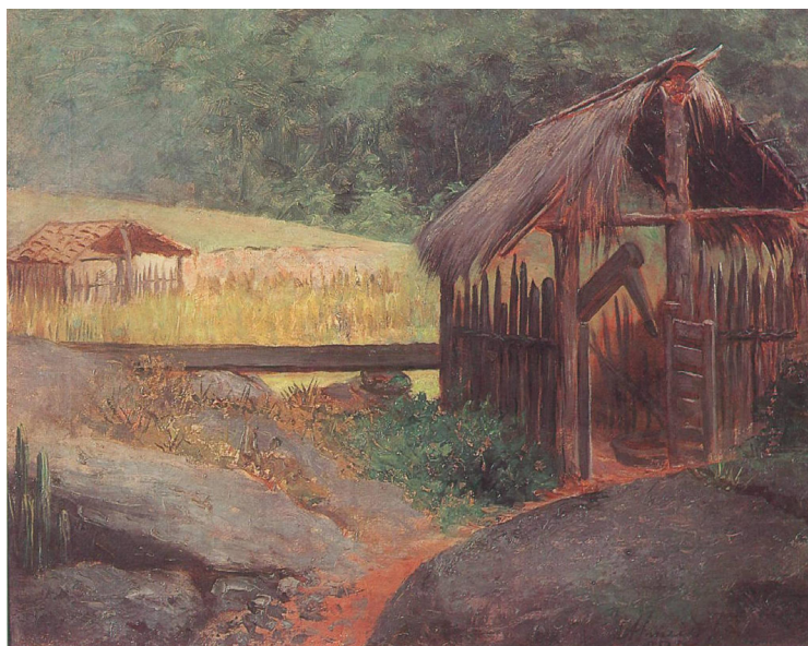
Figura 2 – Almeida Júnior. Monjolo (1895), Óleo sobre tela, 46 x 59 cm, coleção particular.

Na mesma época em que Almeida Júnior expunha o quadro Monjolo , um pintor de trajetória completamente distinta também escolheu o rudimentar maquinismo como tema, resultando, contudo, em uma composição muito distante da do pintor brasileiro. Tratava-se do exímio paisagista italiano Antonio Ferrigno (1863-1940), que chegara ao Brasil dois anos antes, em uma estadia bastante profícua que se estendeu até 1905, quando retornou à Itália. 13 Nesse período, percorreu diversas regiões do Estado, oferecendo seus serviços e atendendo encomendas feitas, principalmente, por grandes cafeicultores.