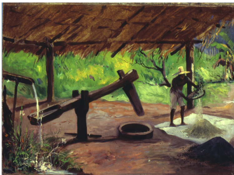
Figura 5 – Alfredo Norfini. Monjolo comum, primórdios da lavoura paulista (1922). Óleo sobre tela, 48 X 65cm, acervo do Museu Paulista.

A grande contribuição de Norfini para a seção expositiva sobre o cultivo do café, contudo, não veio de suas soluções compositivas, mas sim de sua atuação como uma espécie de “agente de campo” do Museu, a quem cabia não só buscar por temas que pudessem ser pintados in situ , como a identificação de itens de interesse para o acervo. Nesse ponto, a grande familiaridade de Norfini com algumas importantes famílias de fazendeiros de Campinas permitiu a incorporação de novos temas à série de pinturas e também a doação de um item que o próprio Taunay reconhecia como uma das melhores peças adquiridas para a exposição: a máquina de despolar café, conhecida como “carretão”.