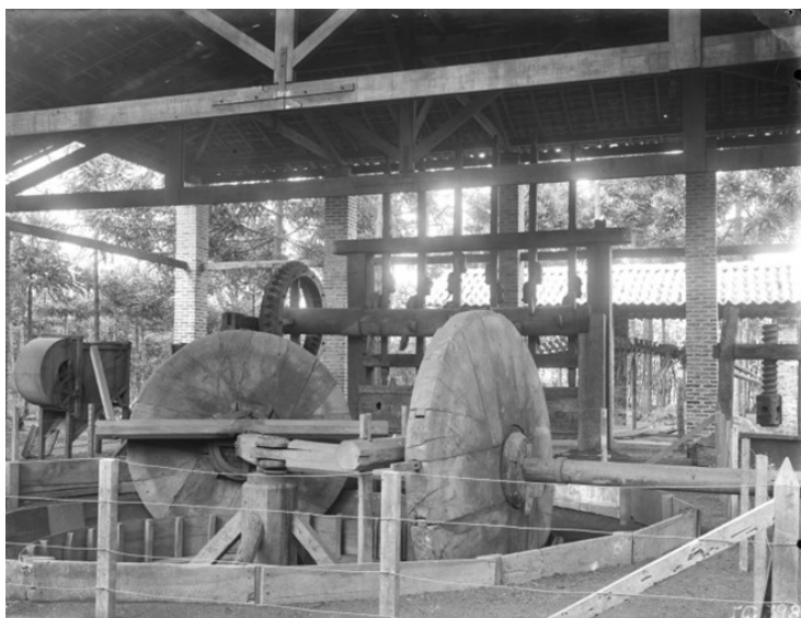
Figura 7 – Pavilhão de máquinas agrícolas do Museu Paulista (s. d.).

quando um barracão para abrigá-lo foi construído nos fundos do Museu (Figura 7). A forma encontrada para contornar o atraso foi contratar mais uma encomenda de Norfini: a tela Carretão para beneficiar café – Campinas 1850 , na qual o maquinismo aparece ainda montado na fazenda da Lapa – o único quadro entre todas as encomendas de Taunay para a exposição de 1922 que foi pintado in situ e, sem dúvida, a melhor obra de Norfini no acervo do Museu (Figura 8).