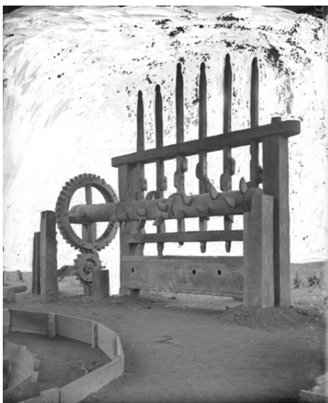
Figura 6 – Engenho de pilões da faz. Boa Vista, (s. d.).

Na correspondência trocada entre Taunay e Novaes para fechar o negócio e acertar o transporte até São Paulo, o fazendeiro também remeteu às dificuldades nas buscas que vinha realizando para encontrar um carretão que pudesse ser adquirido pelo Museu: