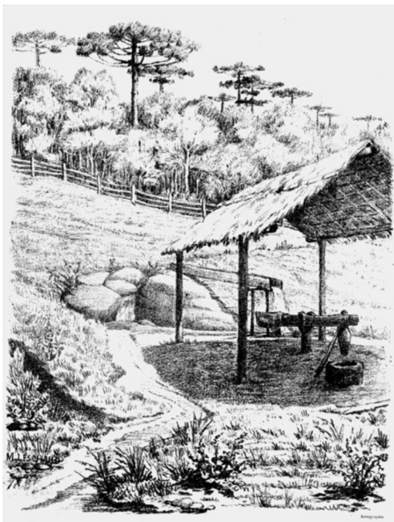
Figura 1 – Marcos Leschaut. “O monjolo – arredores de Curitiba” (1889), litogravura. A Galeria Allustrada , ano 1, nº 14, p. 118.

O caráter documental da gravura de Leschaut, suíço contratado como cartógrafo e desenhista pela presidência do Paraná, permite considerá-la como a última e melhor imagem oitocentista de um monjolo feita por um estrangeiro. Já na década seguinte, o valor evocativo desses maquinismos começou a ser ressaltado por pintores e literatos brasileiros de distintos graus de talento, que nele viram um motivo de grande potência para tecer imagens (também bastante diversas) sobre a vida no campo. Ao mesmo tempo, ensaios e estudos sobre a formação da nacionalidade fizeram dele um marcador de identidades