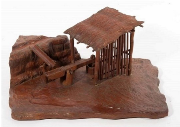
Figura 10 – A. Tacci. Maquete de monjolo hidráulico (1954). Acervo do Museu Paulista.