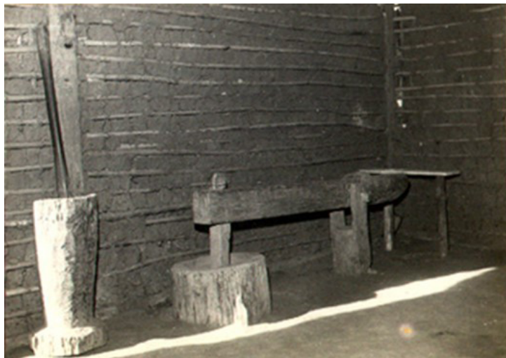
Figura 14 – Anônimo. Monjolo de pé na Casa do Bandeirante (1958). Positivo em preto e branco, 8 X 11 cm.