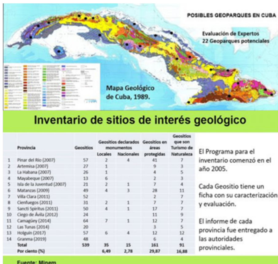
FIGURA 1. Geoparques potenciales e inventario de geosítios.

metodológicas y programas, que favorezcan el desarrollo de una cultura patrimonial que garantice la identificación, conservación y protección del patrimonio natural y, consecuentemente, del geológico.