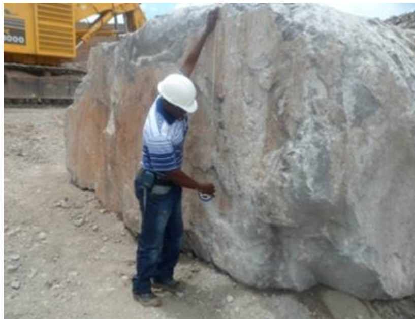
FIGURA 1. Fragmentos sobredimensionados.

1), precisándose por ello de un gran volumen de trabajos para la fragmentación secundaria, los cuales traen aparejado numerosos inconvenientes y el encarecimiento de las labores.