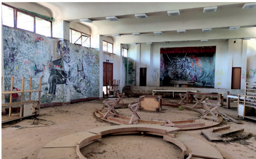
Fig.2 E. De Conciliis, El sistema clientelista mafioso y la no violencia, 1968-69, Centro de Estudios "Borgo di Dio", Trappeto (PA).

En la pared de la derecha (Fig. 6), otro panel reproduce el colapso del sistema capitalista con la caída del tótem-títere rodeado de bienes de consumo (Fig. 7). Le sigue una pintura abstracta: un conjunto de líneas y elementos geométricos sugieren la idea de energía positiva y simbolizan una revolución-evolución cósmica. El siguiente cuadro muestra una rosa que contiene a una comunidad de hombres, mujeres y niños que trabajan por un mundo mejor. (Fig.8) El mural termina con la escalofriante imagen de un niño en el interior de una lata de conserva como un trozo de carne para ser consumido, símbolo de la alienación y explotación del ser humano (Fig. 9).