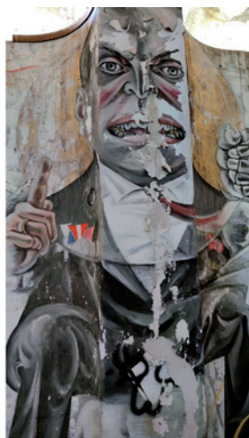
Fig.3-4 E. De Conciliis, El sistema clientelista mafioso... (detalle).