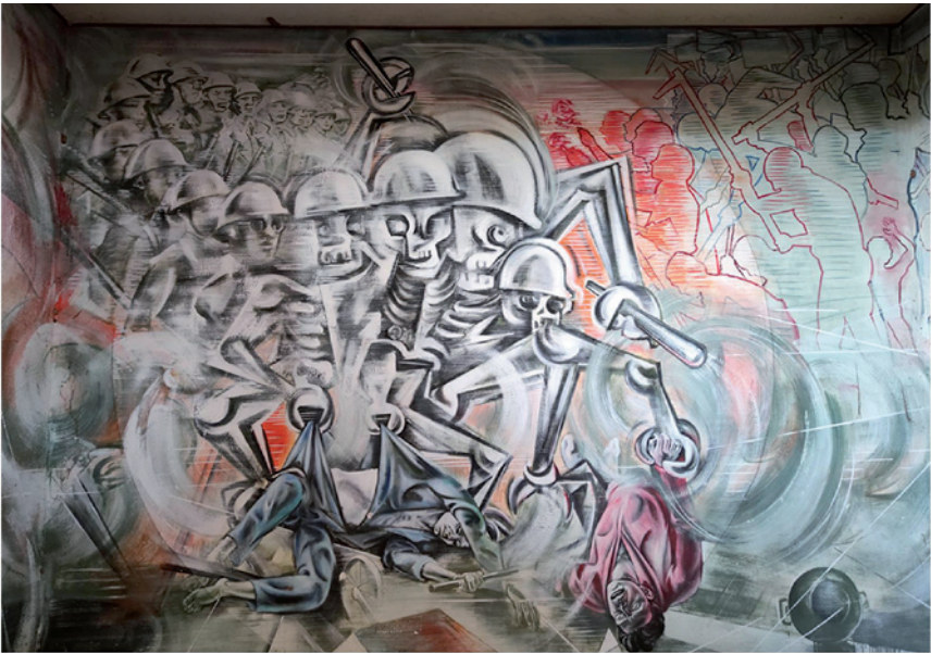
Fig.5 E. De Conciliis, Huelga a revéz, 1968-69, Centro de Estudios "Borgo di Dio", Auditorium, Trappeto (PA).

Lo más significativo de esta producción pictórica es la gestión de todo el proceso, la cual se lleva a cabo mediante una participación real desde la base tanto en la planificación y el diseño como en la ejecución. La idea inicial se comparte y se debate, los bocetos se realizan y se someten a discusión popular. Como dice De Conciliis: "fue una obra colectiva porque trabajamos juntos, vivimos juntos, pensamos juntos" ( Centro arte pubblica popolare 10).