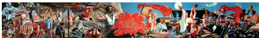
Fig.11 Aurelio C., El camino italiano hacia el socialismo, 1972, Casa de Popolo, Valenza Po (AL), actualmente en la Fundación Luigi Longo de Alessandria "Cargo21".

de 1972 con el título El camino italiano hacia el socialismo (Lenti s/p.). Consta de once paneles de faesita pintados con colores acrílicos y vinílicos, tiene una longitud total de 20 metros y una altura de 3 metros (fig.11).