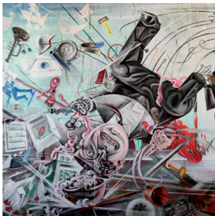
Fig.7 E. De Conciliis, La caída del capitalismo ( detalle ).