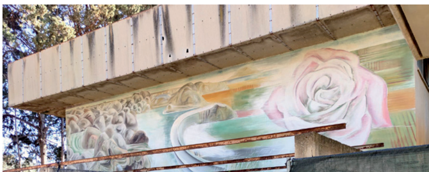
Fig.1 E. De Conciliis, La presa del río Jato, 1968-69, Centro de Estudios “Borgo di Dio”, Trappeto (PA).

artista a actuar para apoyar la labor del Centro de Trappeto, utilizando el arte como forma de denuncia y construcción de la esperanza. El mural se realiza en las paredes del auditorio. En el muro exterior, está representada la presa del río Jato, cuya construcción comenzó en 1963 en la zona de Partinico 18 tras decenas de denuncias y movilizaciones de Danilo Dolci y sus colaboradores. Desde entonces esta construcción ha permitido a la población local tener acceso al agua y liberarla del chantaje mafioso, y se ha convertido en uno de los símbolos de la lucha para mejorar las condiciones de vida de la población siciliana y del compromiso contra la influencia mafiosa en la zona. La elección de representar la presa en la fachada del auditorio, en la entrada del Centro de Dolci, junto a una gran rosa que destaca en el cielo como símbolo de redención y de la responsabilidad colectiva, hace que el mural sea casi un manifiesto, una loa, a los logros alcanzados (Fig.1).