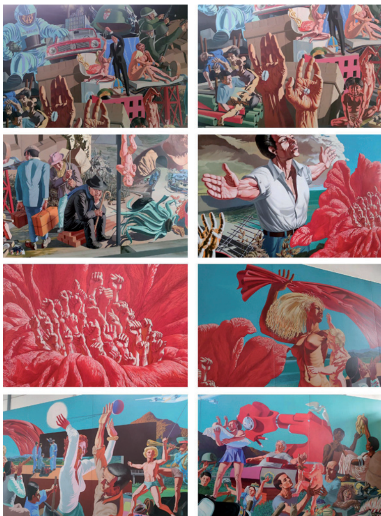
Fig.12-19 Aurelio C., El camino italiano hacia el socialismo (detalles).

Las obras que hemos analizado son un ejemplo de la existencia en Italia de una producción pictórica de gran formato destinada a lugares públicos y concebida con un fin social capaz, por una parte, de reavivar la gran tradición muralista italiana y, por otra, de contaminarse con el muralismo mexicano y de abrirse a las novedades del arte internacional. Por su carácter identitario y político, los murales italianos son similares a los mexicanos, pero en muchas ocasiones lo que varía es la naturaleza de las intervenciones. Es decir, las obras mexicanas se crean en contextos institucionales, son comisionadas y pagadas por el Estado y se ubican en edificios públicos, mientras que en el caso italiano, se crean en lugares de encuentro de la sociedad civil como sedes de partidos, oratorios, centros culturales, a menudo en territorios provinciales.