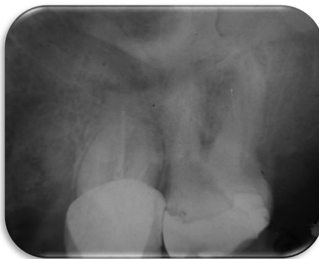
FIGURA 1 RADIOGRAFÍA INICIAL

Paciente femenino de 51 años de edad, acude a la clínica de odontología de la Escuela Nacional de Estudios Superiores, Unidad León, UNAM; quien refiere padecer diabetes tipo II controlada farmacológicamente. Es referida a la clínica de profundización de endodoncia y periodoncia donde se realizó examen clínico y radiográfico del diente 17, observándose una restauración con resina mal ajustada y caries (Figura 1).