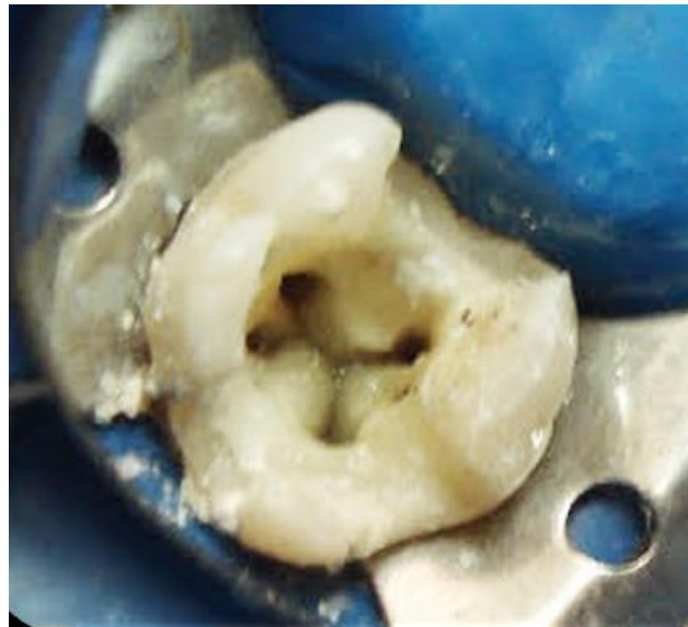
FIGURA 2 ACCESO DONDE SE MUESTRA LA ENTRADA DE LOS CUATRO CONDUCTOS

Se estableció la conductometría real de los cuatro conductos usando el localizador electrónico de