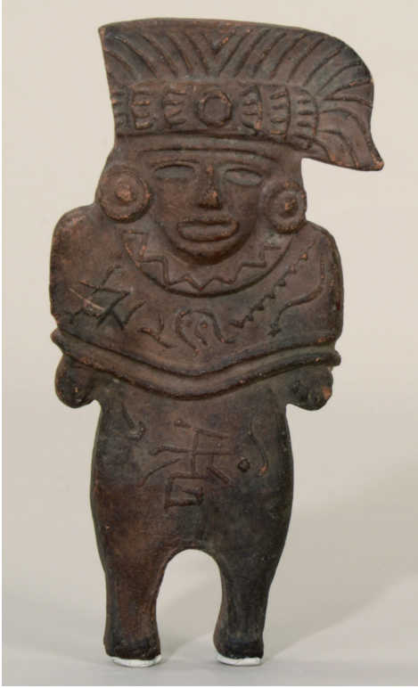
Figura 10. Falsificación con rasgos teotihuacanos (Museo de Etnografía, N° de inv.: 70.70.53).

en molde, similarmente a las copias de yeso, pero no por Horti, sino más bien adquiridas en el mercado del arte, si tomamos en cuenta su anverso (Figura 10). Mientras su rostro fue plasmado en forma de una máscara del estilo teotihuacano, en su pecho y vientre lleva la imagen espejular del mismo signo de puntuación chino que significa fragancia (香). Posiblemente se trata de un souvenir fabricado en molde y por eso aparece la imagen espejular del signo de puntuación. Considerando que Horti permaneció solo seis días en China, el objeto pudo haber sido conseguido en México.