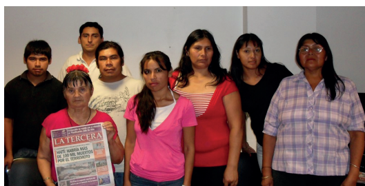
Figura 1. “Consejo Indígena de Almirante Brown” (foto: La Tercera 2010).

El nivel de institucionalización que alcanzó la dirigencia indígena local está cuidadosamente detallado en la documentación de cada uno de los organismos que conformó. Es decir, no sólo está reglamentada parte de la vida política de las comunidades inscriptas con Personería Jurídica en el Registro Nacional de Comunidades Indígena (Re.Na.Ci.); sino también aquéllas que están en trámite por instancias de organización colectiva. El canal de reconocimiento administrativo reglamentó fuertemente la práctica etnopolítica, y muchas veces ese reglamento fue utilizado como herramienta para reordenar el campo etnopolítico local tal como hemos visto.