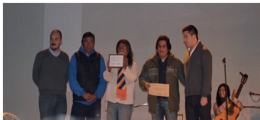
Figura 3. Entrega de certificados a los miembros del “Consejo Indígena de Almirante Brown”.