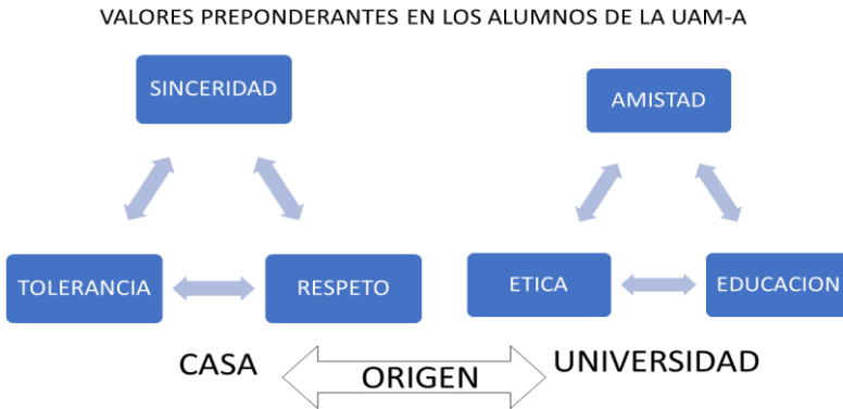
Gráfico 2. Valores más importantes para los alumnos de la UAM-A.