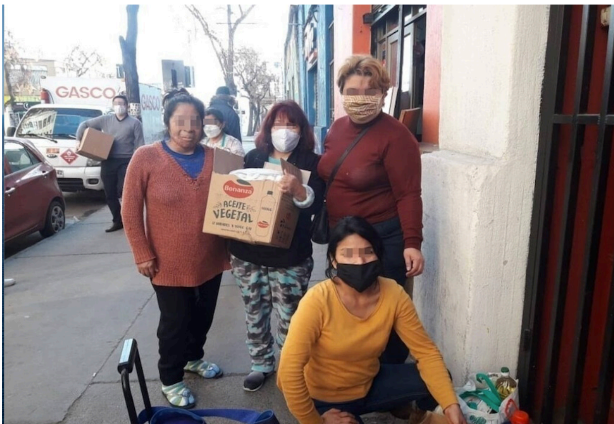
Figura 1. “Nos ayudamos entre nosotras”.