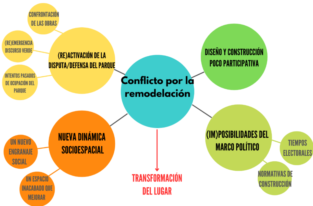
Figura 3. Mapa temático.