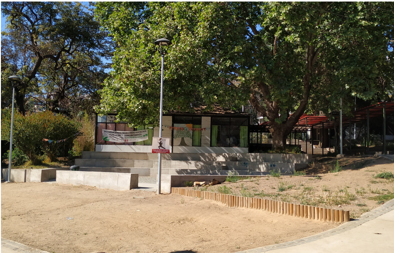
Figura 2. Imagen frontal del parque post-remodelación.