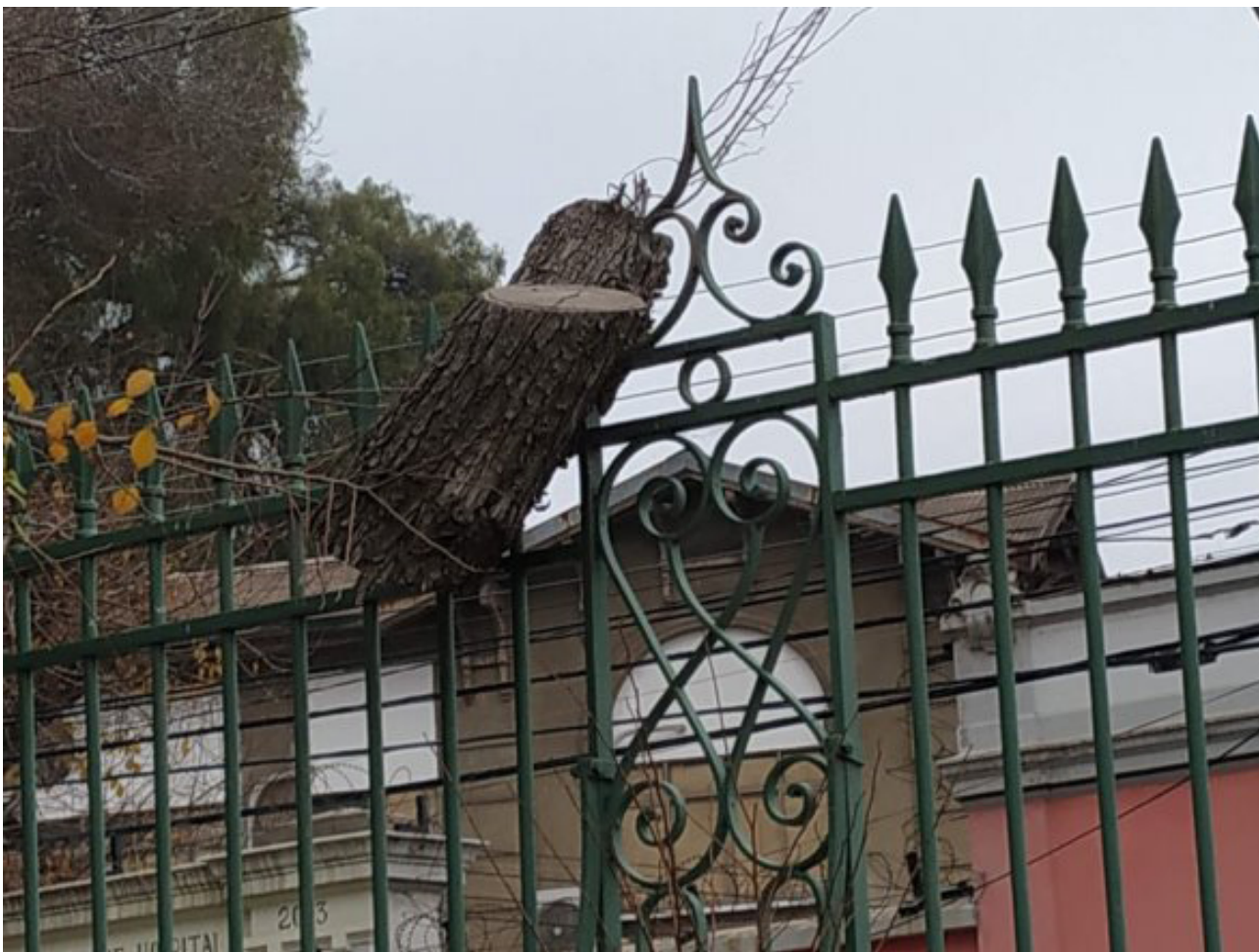
Figura 4. Fotografía tomada por Carlos de fragmento de árbol.