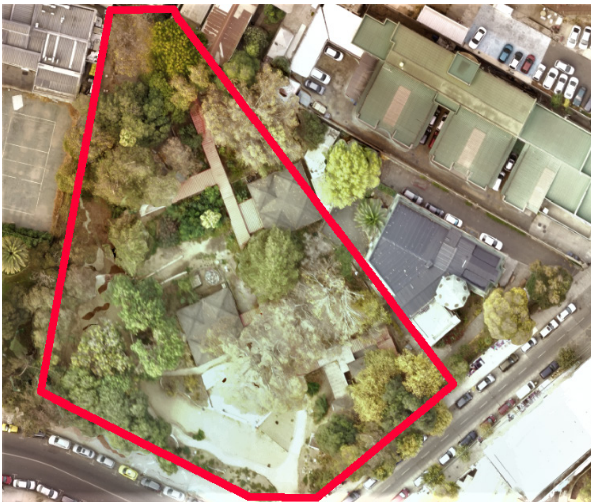
Figura 1. Imagen cenital del parque post-remodelación con el contorno destacado en rojo.