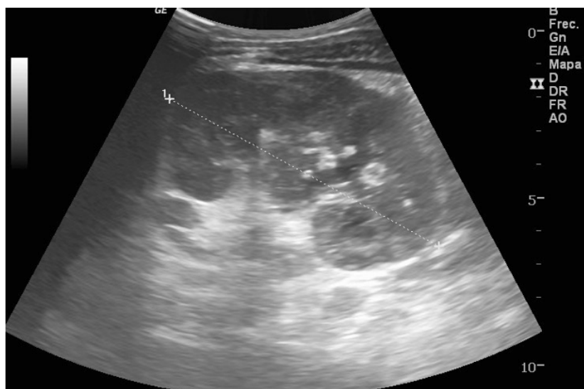
Foto 1. Ecografía abdominal

Imagen del riñón izquierdo, dilatación de las cavidades colectoras, aumento de la ecogenicidad del parénquima renal, inadecuada diferenciación corticomedular, imágenes de calcificaciones al interior de las cavidades colectoras con evidencia de detritus en el interior de las cavidades colectoras que sugieren piodenitis. (Fuente: Departamento de Radiología e imágenes diagnósticas - San Vicente Fundación Medellín).