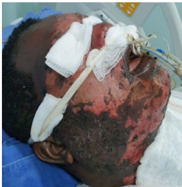
FIGURA 2: Paciente no 4º dia de internação apresentando queimadura de 1º e 2º graus na face após a remoção do betume com vaselina líquida