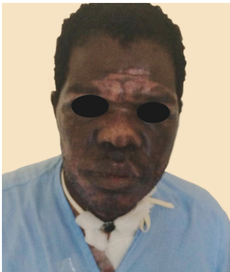
FIGURA 3: 37º dia de internação: paciente apresentando boa recuperação do estado geral e hipocromia residual pós cicatrização na região central e lateral da face

ferramentas (16%). 16 Os eventos associados a explosões ou contato com fontes de calor, como no presente caso, são responsáveis por apenas 1 a 2% dos acidentes de trabalho na construção civil, mas, em geral, são casos graves. 16,17 O perfil das vítimas de acidente de trabalho na construção civil no Brasil tem grande predominância do sexo masculino (quase 100%), acometendo,