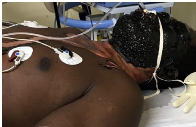
FIGURE 1: Paciente sob ventilação mecânica apresentando placa de betume aderida em toda a face e descolamento de pele em região cervical e torácica

Evoluiu com necessidade de intubação orotraqueal, sedoanalgesia, ventilação mecânica, hidratação parenteral, conforme a fórmula de Parkland, e cuidados em unidade de terapia intensiva (UTI). Apresentou melhora significativa do quadro respiratório com progressão dos parâmetros ventilatórios para