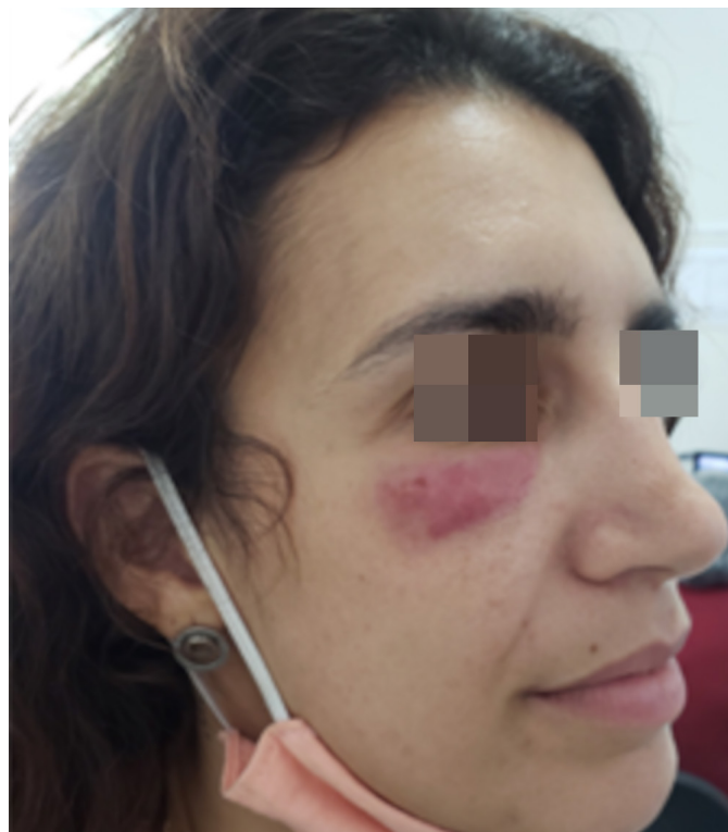
FIGURA 1: Nódulo eritematoso na região infrapalpebral direita

Como comorbidade, a paciente apresentava leucemia mieloide crônica, em acompanhamento com a Hematologia do mesmo hospital. Fazia uso regular de nilotinibe 400mg duas vezes ao dia, fluoxetina 20mg por dia e clonazepam 1mg por dia. Não possuía história de alergias medicamentosas.