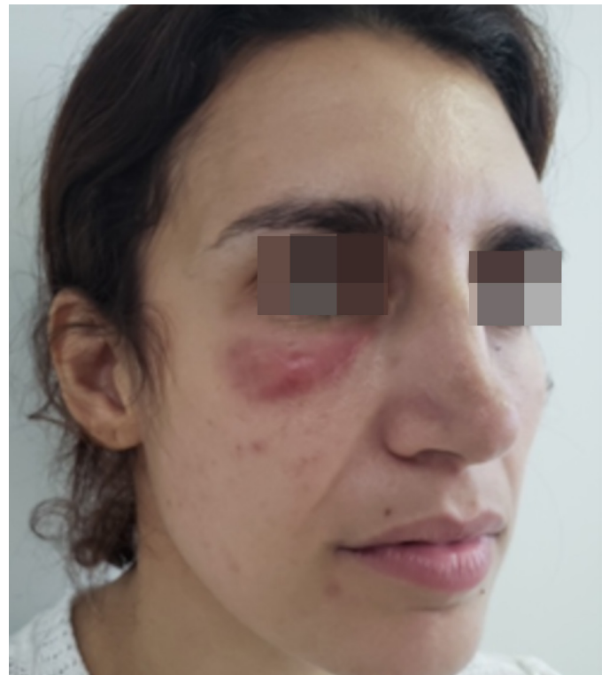
FIGURA 3: Resultado após quatro infiltrações de triancinolona

síntese de colágeno. Há muitos relatos de sucesso no tratamento de granulomas de corpo estranho causados por Artecoll, ácidos hialurônicos e Matridex, usando-se injeções intralesionais de esteroides. 2 Deve ser injetado estritamente no nódulo, segurando-o entre dois dedos. Forte resistência à agulha deve ser sentida. Se essa terapia for iniciada precoce e agressivamente, excisão cirúrgica poderá não ser necessária. 3