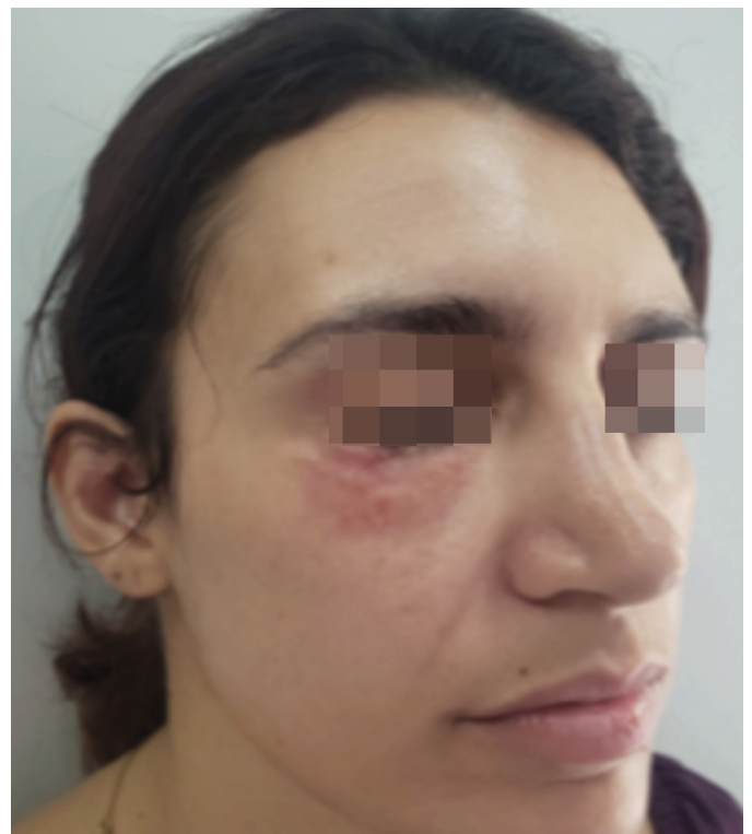
FIGURA 4: Resultado após quatro abordagens cirúrgicas

A bleomicina, pela experiência com queloides e cicatrizes hipertróficas, também pode funcionar em granulomas. Os corticoides sistêmicos devem ser usados para granulomas recorrentes. As doses devem ser maiores do que as usadas em injeções