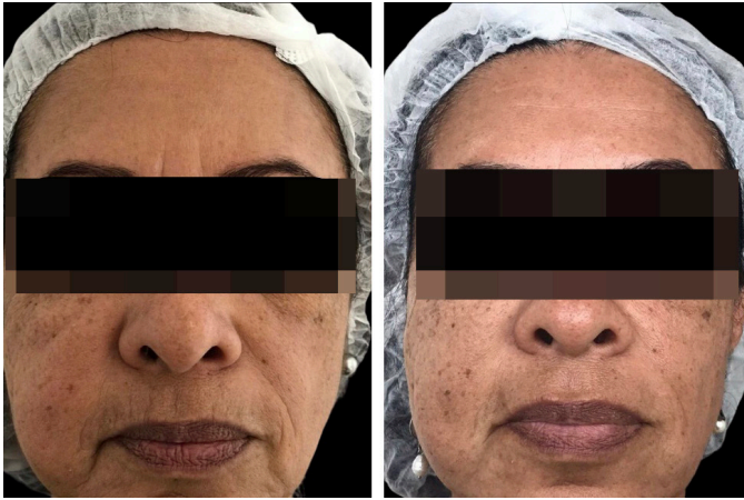
FIGURA 2: Foto comparativa de antes do tratamento (esquerda) e após o tratamento (direita). Melhora evidente de gordura da hemiface direita