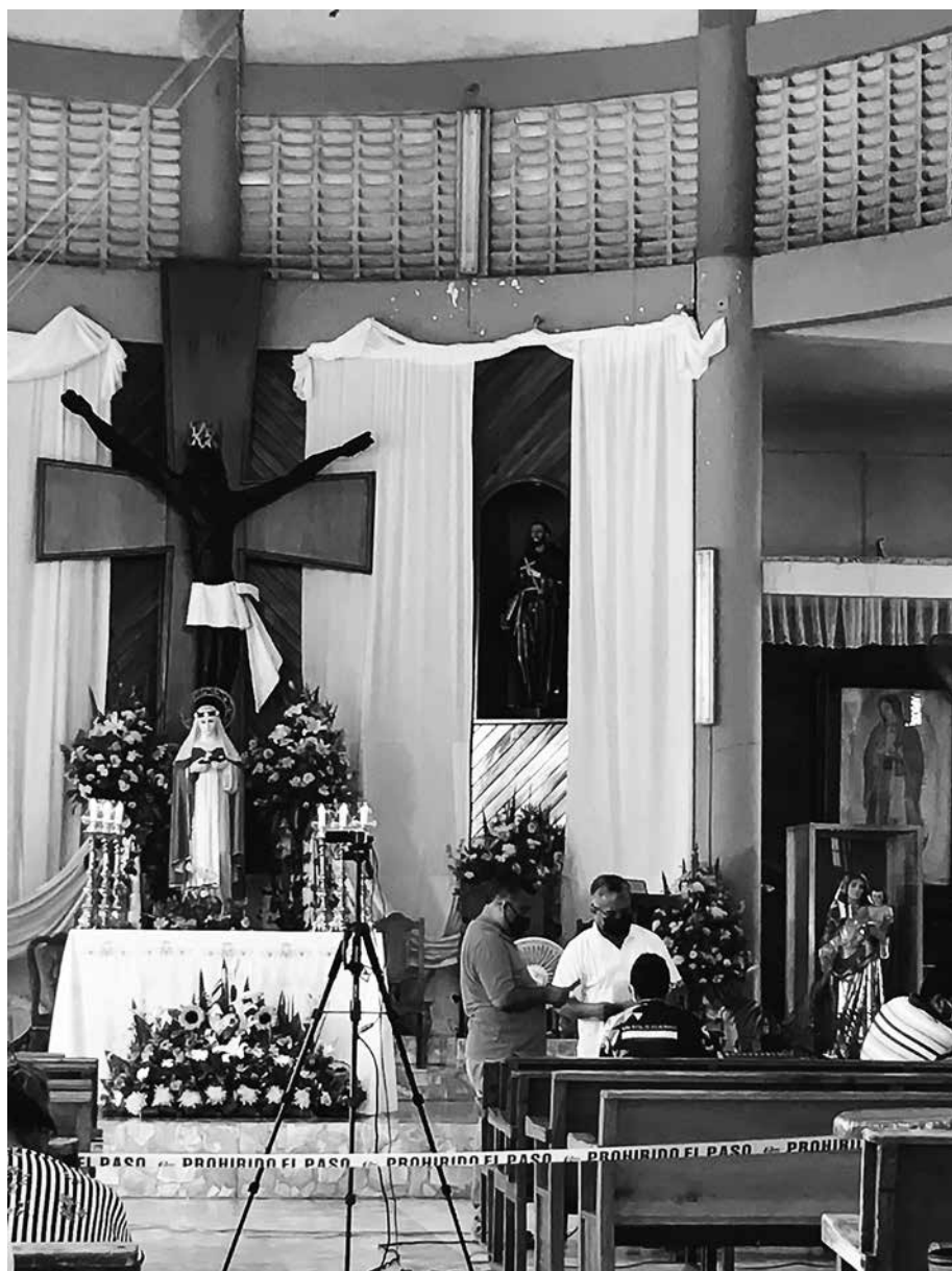
El ritual, Jáltipan, Veracruz.