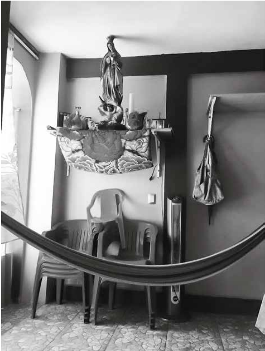
Mis flores, Coatzacoalcos, Veracruz.