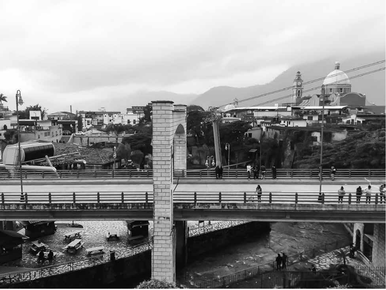
Custodia, Orizaba, Veracruz.