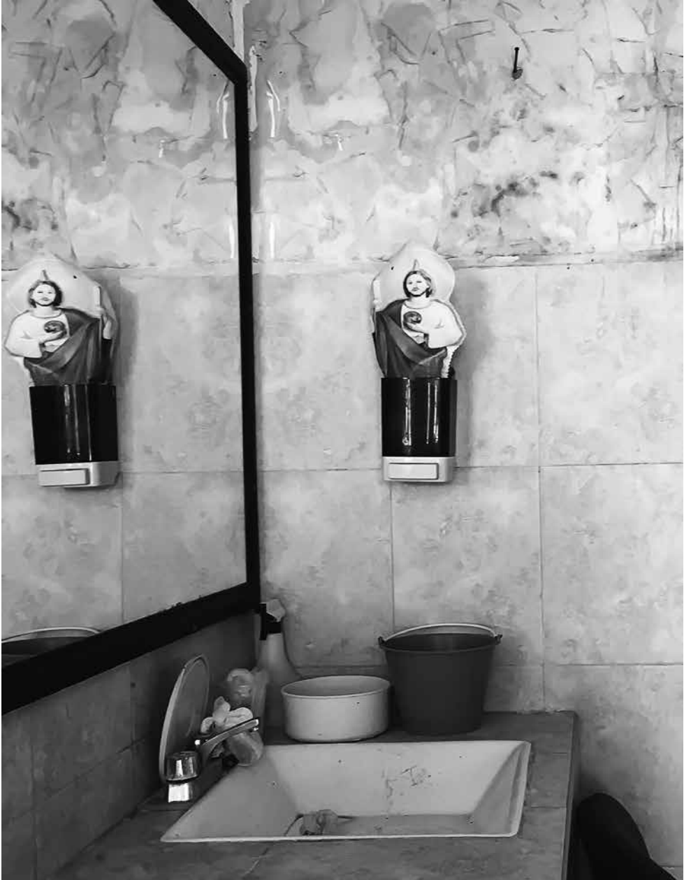
Reflejo, Jáltipan, Veracruz.

Página opuesta, Brillas y brillas tan lindo , Centro Histórico, Ciudad de México.