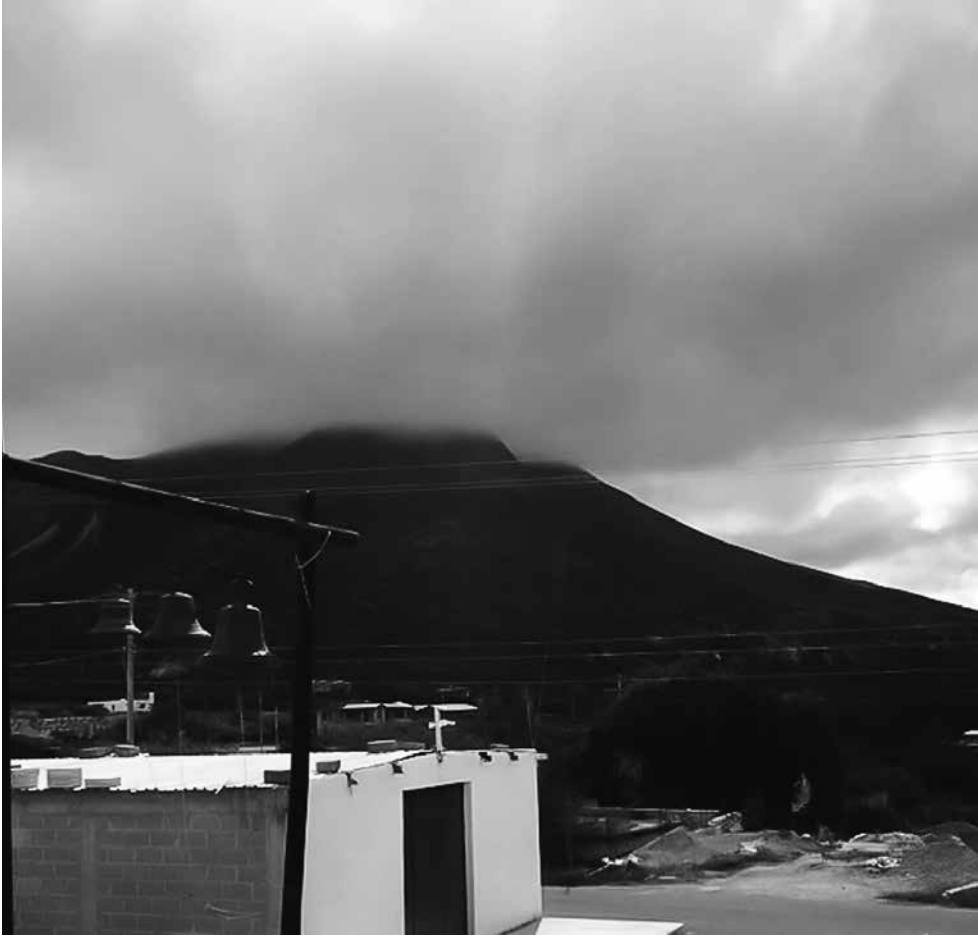
Campanario, Cardonal, Hidalgo.