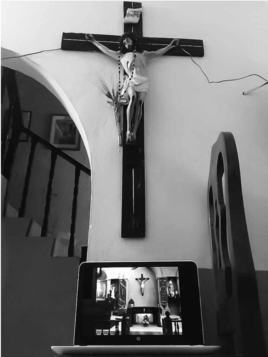
Y sí, también usa Facebook, Coatzacoalcos, Veracruz.