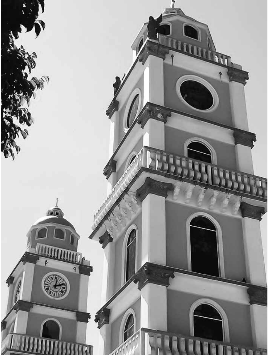
Pilares, Jáltipan, Veracruz.