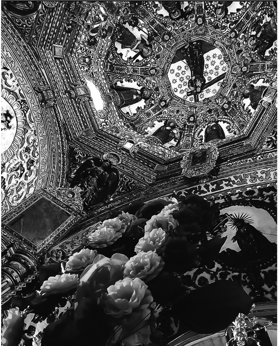
Cera-crea , Tlacolula de Matamoros, Oaxaca.