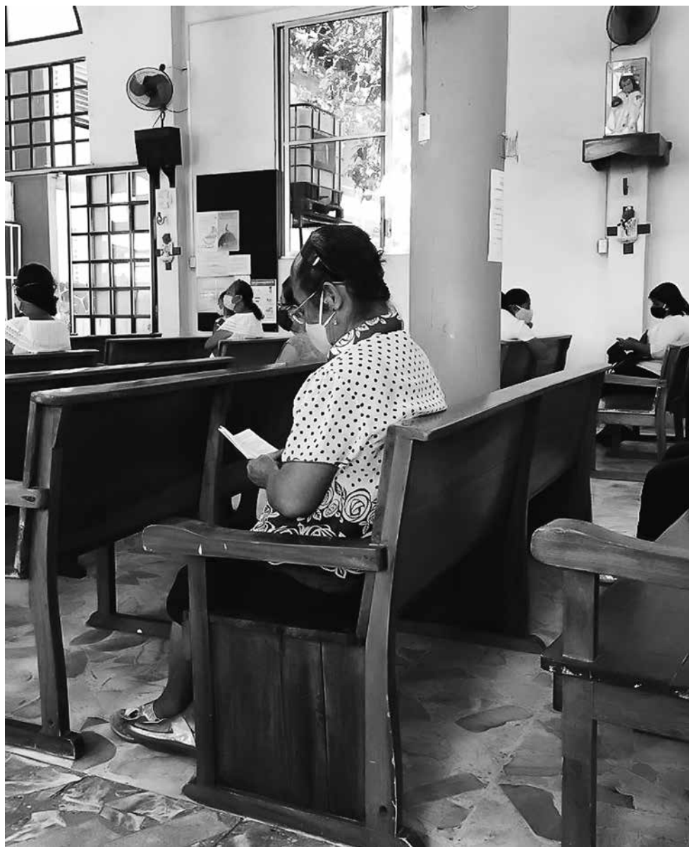
Te cuento, Jáltipan, Veracruz.