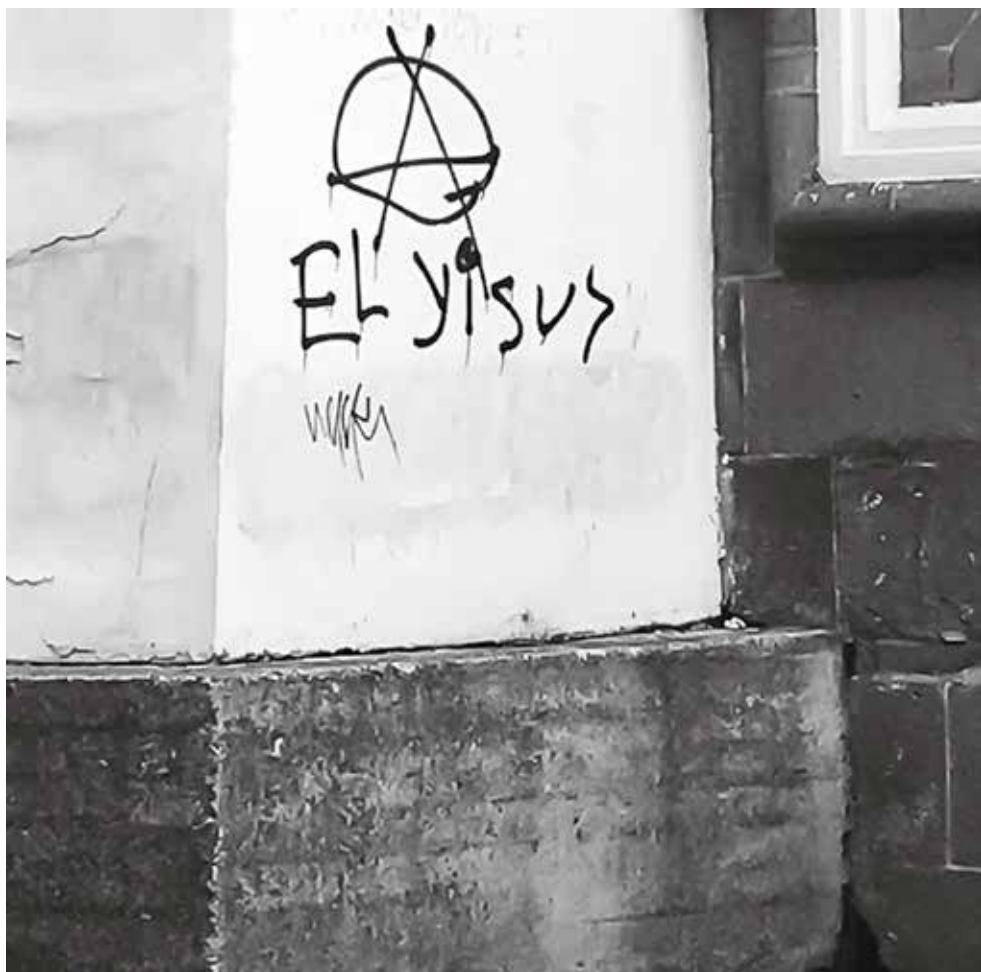
Ese Yisus es un loquillo, Puebla, Centro.