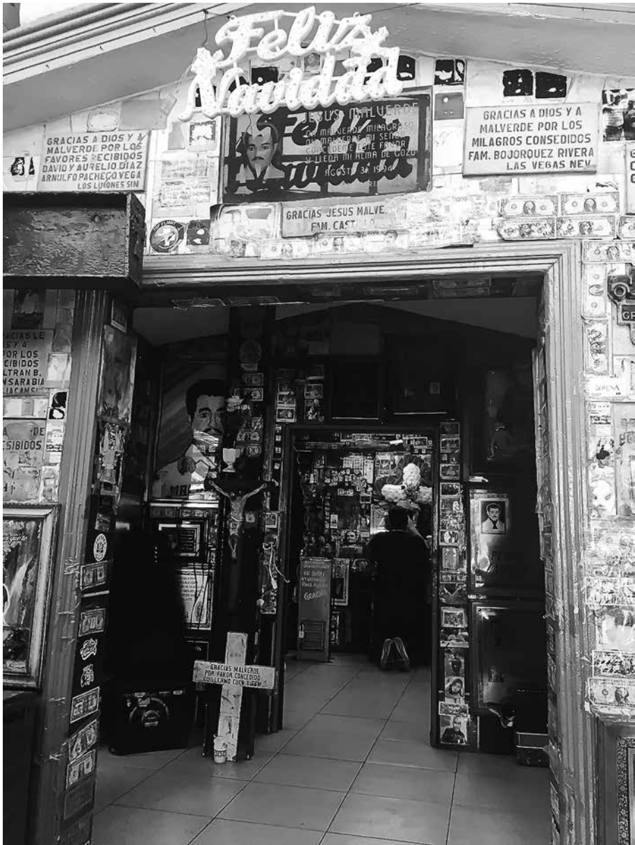
El Santo Patrón, Templo Malverde, Culiacán Sinaloa.