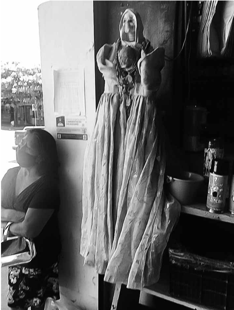
Él te escucha, Jáltipan, Veracruz.