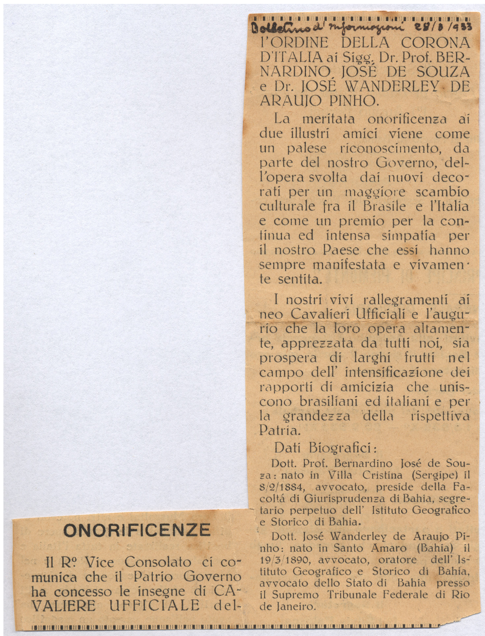
Figura 2 - Recorte classificado à caneta como "bolletino d'informazioni", provavelmente do vice-consulado italiano no Brasil.