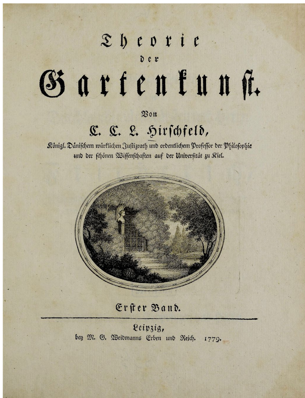
Figura 8 – Frontispício do primeiro volume da Theorie der Gartenkunst (Teoria da arte do jardim) de Christian Cay Lorenz Hirschfeld, 1779-1785.

a atenção para um jardim-paisagem criado pelo conde M., por meio do qual foi possível, aos olhos de Werther, tornar a região em um perfeito idílio nos moldes daquele poetizado por Geßner. O jardim era simples, sem a pompa cerimonial do jardim francês, pois se tratava de uma obra elaborada por mãos sem especialidade técnica – “nenhum jardineiro cientista” 94 –, mas por um “coração sensível que queria gozar o prazer de estar consigo mesmo”. 95