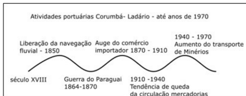
Figura 1 - Comércio portuário de Corumbá e Ladário entre 1800 - 1970. Fonte: Elaboração gráfica do autor

Outro flanco de discussão, e que veremos à frente, é que o ciclo das atividades comerciais portuárias no Rio Paraguai na segunda metade do século XIX não se encerrou de modo abrupto. Diferente disso, as atividades portuárias sofreram redefinições econômicas e funcionais sob a dinâmica de outros segmentos produtivos e que deram sustentabilidade econômica e urbana para a cidade, tal como se sucedeu com a emergência das atividades extrativas minerais e a consequente refuncionalização portuária (figura 1):