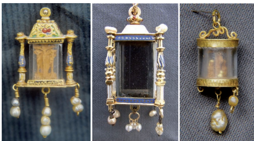
Fig. 34. Viril de templete. México, c. 1570. Oro esmaltado, perlas, cristal de roca y boj.