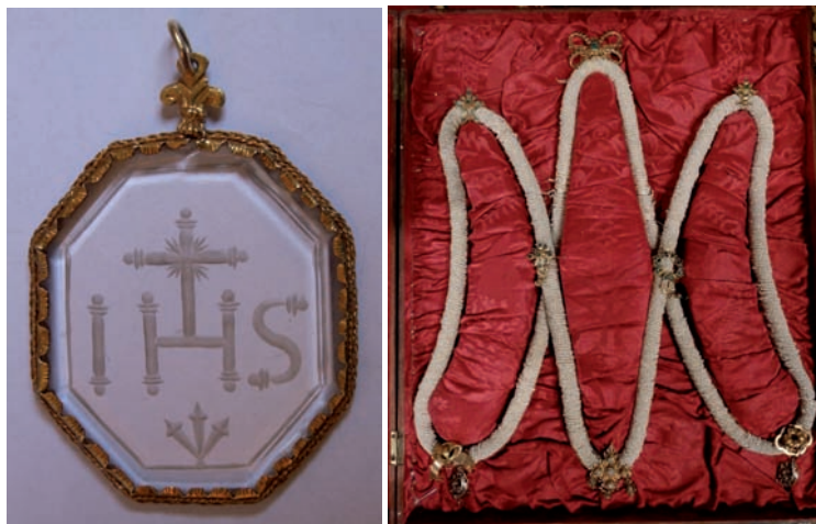
Fig. 18. Nombre de Jesús. Milán (cristal de roca)-España (montura de oro), c. 1620-1630.

... di a mi hixto que este nombre le dio por mui afecto, que me haga el vestido que desea darme y que sea verde como a él le ha paresido y que el verde sea este representándosele que es color maduro y que ponga mi nombre bordado en la saya con su corona, representándole la forma y me haga bordar una custodia en el pecho que me sirva de hoia en este vestido; buscase la muestra del color y se halló muy a similitud de lo representado, bordose la ropa y quedó el nombre muy paresido a el que Nuestra Señora representó 74 .