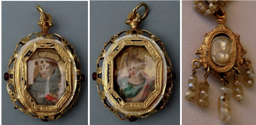
Figs. 37 y 38. Medallón relicario, c. 1590-1600. Oro esmaltado. Fig. 39. Medallón relicario, principios del siglo XVII. Oro, perlas y restos de esmalte.

Palma) en las primeras décadas del siglo XVII, al igual que otro agnus engarzado en plata con una imagen de Santa Teresa por un lado y unas reliquias por el otro (1705) 113 . Ininterrumpidamente inventariada a partir de 1764, la llamada joya de Santa Teresa , claramente individualizada en algunos retratos de la virgen del Pino de finales del siglo XVIII, prendida del extremo inferior del rostrillo y unida a un mazo de perlas, presentaba ventana oval con una iluminación de la santa de Ávila y 30 diamantes en derredor (1859).