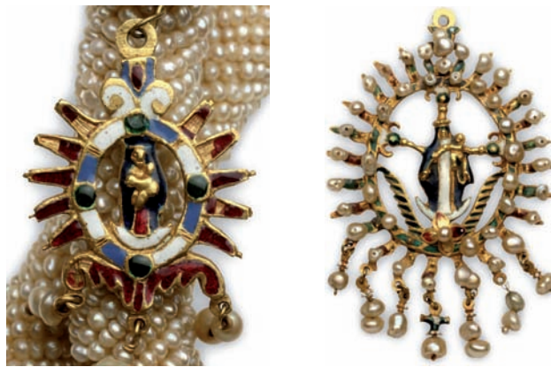
Fig. 62. Medalla de la Virgen con el Niño, c. 1620-1630. Oro esmaltado y perlas. Fig. 63. Medalla de la Virgen con el Niño. La Habana, anterior a 1675. Oro esmaltado y perlas.