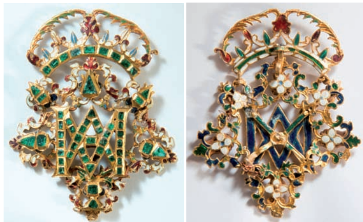
Figs. 16 y 17. Anagrama de María, ¿Sevilla? c. 1630. Oro esmaltado y esmeraldas. Anverso y reverso.