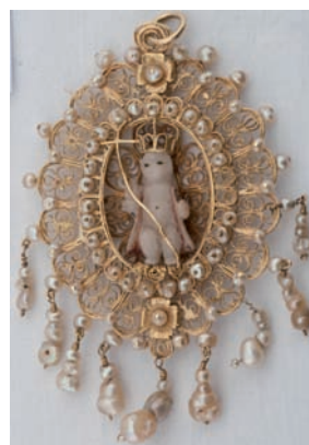
Fig. 45. Medallón-relicario de filigrana, último tercio del siglo XVII. Oro y alabastro con restos de esmalte.