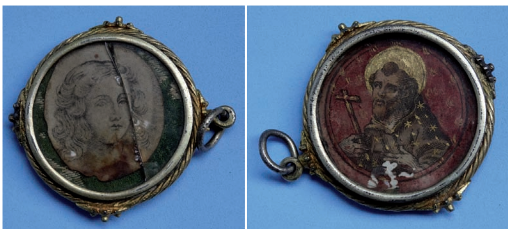
Figs. 40 y 41. Medallón-relicario, fines del siglo XVII. Plata sobredorada. Anverso y reverso.