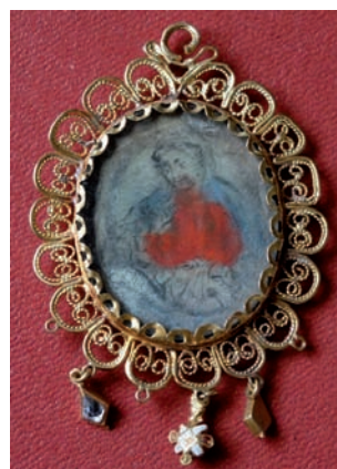
Fig. 51. Medallón-relicario de filigrana, c. 1700-1725. Oro y perlas.