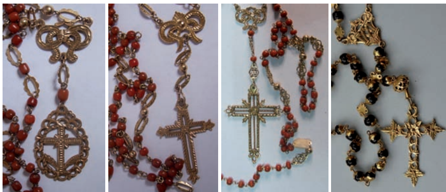
Figs. 87, 88 y 89. Rosarios. ¿La Habana? Siglo XIX. Oro y coral.