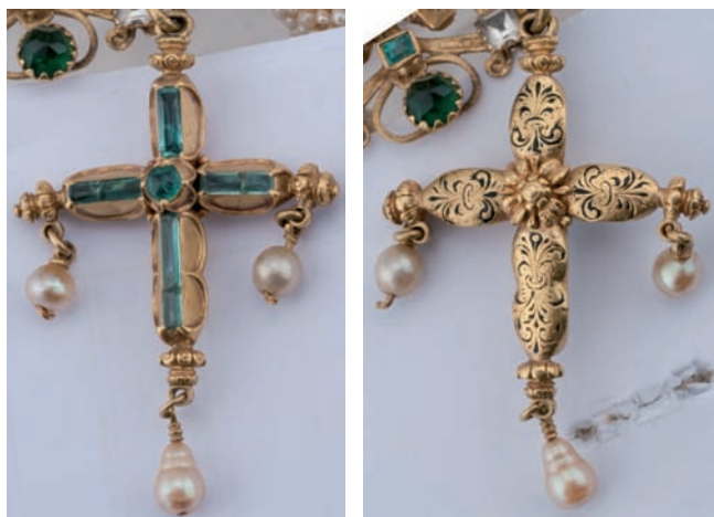
Figs. 23 y 24. Cruz pectoral, c. 1560. Oro esmaltado, esmeraldas y perlas. Anverso y reverso.

Elemento devocional y protector de primer orden, las cruces pectorales adoptaron diversas formas y dieron lugar a una gran diversidad tipológica. Entre los escasos ejemplares anteriores al siglo XVIII caben destacar varias piezas conservadas en la isla de La Palma. La más antigua de ellas es una cruz abalaustrada de hacia 1560, en oro y esmeraldas, que forma parte del joyero de su patrona (fig. 23), con decoración excavada y esmaltada en negro al dorso que dibuja ramilletes simétricos de tallos y roleos con ataduras anilladas (fig. 24). Sobre sus brazos, de bordes festoneados, rematados en tres formas ajarronadas o perillones, con argollas para tres perlas pendientes, se disponen cuatro piezas con esmeraldas alargadas embutidas en la masa del metal y una, talla cabujón, en el cuadrón. Su diseño, prescindiendo de la decoración de encaje de cartones que recorren los perfiles, constituye una versión simplificada de un dibujo firmado en 1557 por Pere Pares del libro de Passanties de la ciudad de Barcelona 82 . Un pectoral parecido de esmeraldas y ornato nielado en el reverso se halla en el tesoro de la virgen de Gracia de Carmona (Sevilla) 83 . De posible procedencia castellana o andaluza, el de las Nieves se recoge por