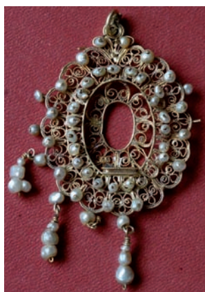
Fig. 50. Medallón-relicario de filigrana, c. 1700-1725. Oro esmaltado, perlas y cristal de roca.