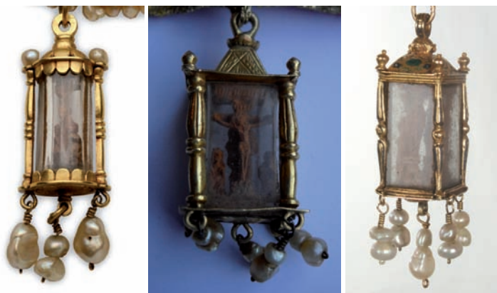
Fig. 31. Viril de linterna. México, anterior a 1574. Oro, perlas, cristal de roca y boj.

dimiento de la cruz (Victoria and Albert Museum, Londres), de finales del siglo XVI, enmarcado en plata sobredorada; un cáliz con figuras en miniatura de boj bajo cristal de roca en el nudo, en forma de templete hexagonal, y en los lóbulos del pie (William Randolph Hearst Collection, Los Angeles County Museum of Art); un portapaz con relieves en boj y aplicaciones de cristal de roca (colección particular), ambos labrados en plata sobredorada y marcados en Ciudad de México hacia 1575-1578; y el rosario de la Buena Muerte (Colonia), con minúsculas tallas de la Pasión sobre plumitas de chupamirto.