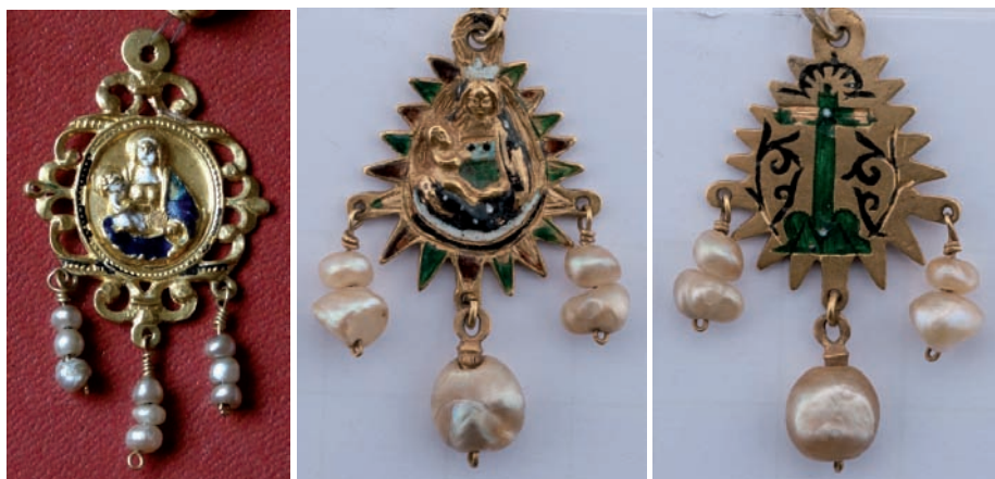
Fig. 57. Medalla de la Virgen con el Niño, siglo XVI. Oro, esmaltes y perlas. Figs. 58 y 59. Medalla de la Virgen con el Niño, siglo XVII. Oro, esmaltes y perlas. Anverso y reverso.