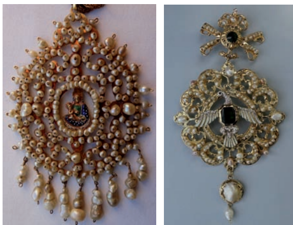
Fig. 69. Joya de pecho con la Virgen con el Niño. La Palma, c. 1705. Oro esmaltado y perlas.

De la estructura de rosa de pecho redondeada y cargada de perlas, con ventana central circular diseñada para una imagen de devoción, propia del último tercio del siglo XVII, deriva la joya de pecho — antes mencionada— que hoy forma parte del ajuar de la patrona de Los Llanos de Aridane con la Virgen con el Niño esmaltada en verde, azul y blanco, confundida en alguna ocasión con una Concepción (fig. 69). De buen tamaño (9 x 7 cm) y peso (tres onzas y media), este medallón oval está constituido por una plancha de oro calada que llegó a tener sobrepuestas por su cara delantera 278 perlas finas y calabacitas de diversos tamaños, taladradas y cosidas por el reverso, así como once chorreras con tres perlas cada una, de las que hoy perduran nueve. Perteneció a la cofradía del Rosario y se mandó hacer en la visita de 1705 con el oro y las perlas de unos zarcillos y unas cuentas sueltas. Su hechura consta en 1705-1711 con un costo de 45 reales 150 .