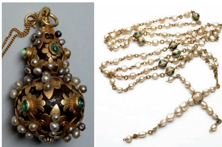
Fig. 7. Poma de ámbar engarzada en oro, perlas y esmeraldas. La Habana, c. 1700-1725. Donada por Dulce María Loynaz.