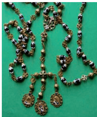
Fig. 74. Rosario. México, c. 1700. Oro esmaltado y coyol.