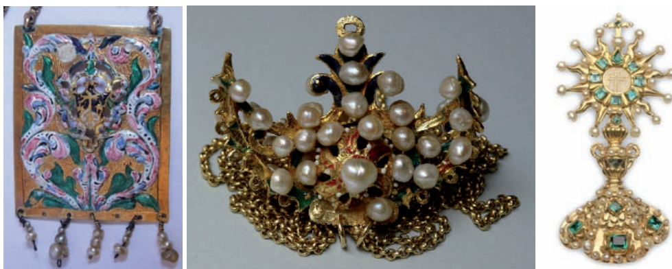
Fig. 20. Escapulario, c. 1730-1740. Oro esmaltado y perlas.