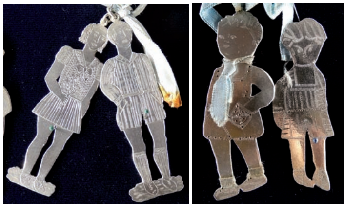
Fig. 11. Exvotos en plata (pareja de enamorados). Siglo XX.