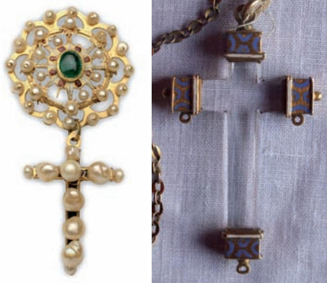
Fig. 29. Rosa y cruz. ¿Indias? c. 1630-1640. Oro esmaltado, perlas y esmeralda cabujón. Fig. 30. Cruz pectoral. Milán (cristal de roca)-España (guarnición de oro esmaltado), c. 1600.