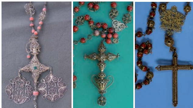
Fig. 91. Rosario, último tercio del siglo XVII. Filigrana de plata y coral.