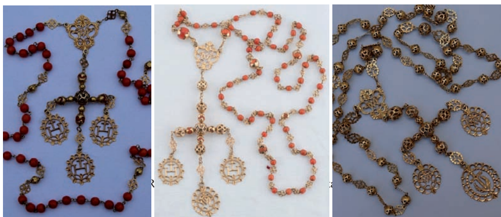
Fig. 80 y 81. Rosarios. México, último tercio del siglo XVIII. Oro y coral. Fig. 82. Rosario. México o Cuba, último tercio del siglo XVIII. Oro calado.