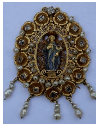
Fig. 48. Medallón-relicario de filigrana, c. 1700-1725. Oro, perlas y esmeraldas.