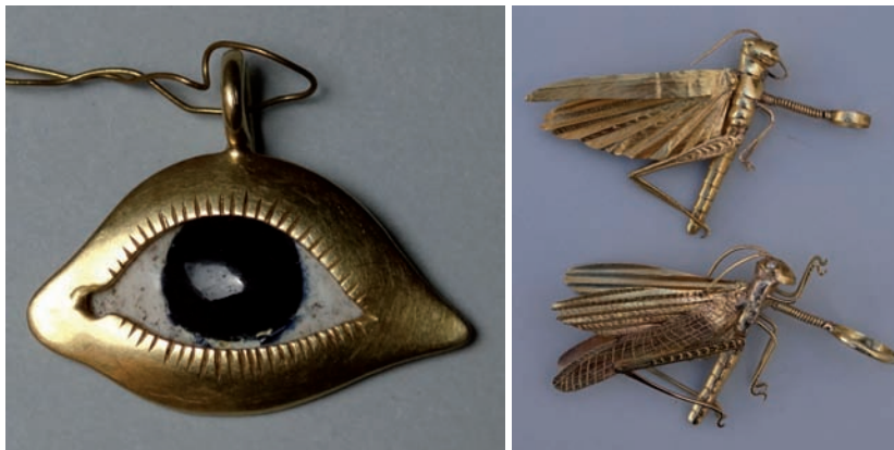
Fig. 9. Exvoto en oro esmaltado (ojo). Siglos XVII-XVIII.

Otros cigarrones semejantes servían de adorno, por razón similar, a la patrona de Buenavista del Norte, Nuestra Señora de los Remedios. Los registros de enseres y alhajas del santuario del Carmen (Los Realejos) consignan diferentes exvotos en oro y plata durante las primeras décadas del siglo XX: dos niños pequeños de plata en 1900, una figurita y una pierna del mismo metal en 1903 y una «piernita» de oro que dio de promesa una persona desconocida entre 1919 y 1932. En la actualidad se conservan varias placas con dibujo inciso o únicamente recortadas en plancha de oro, realizadas ex profeso con ese objeto, como piernas, figuras de niños y de bebés o una niña vestida a la moda de los años veinte, además de dos figuras infantiles idénticas fundidas en oro y plata, añadidas al inventario entre 1903 y 1919 y unidas hoy al gallito del Niño. Carácter de exvotos marineros tienen un pez con su alfiler o un velero donado durante los últimos tiempos 47 , al igual que el de filigrana de oro ofrecido a la virgen de las Nieves de Taganana.