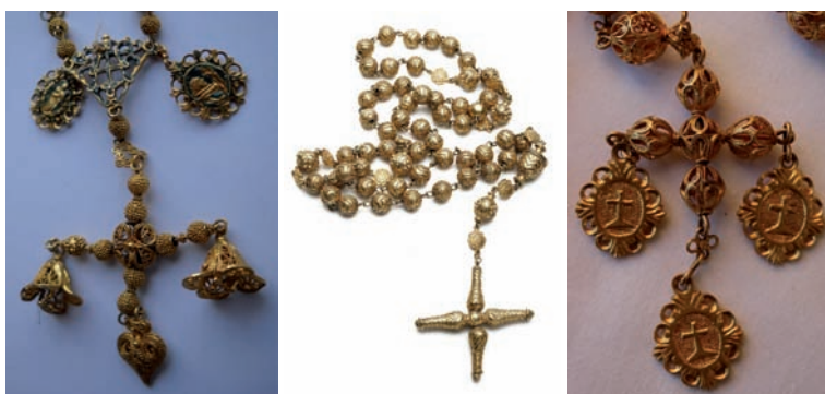
Fig. 94. Rosario. México, c. 1700. Oro esmaltado.

También de corales son dos rosarios de filigrana existentes en las iglesias de Santiago y la Concepción en Los Realejos, uno en oro de la virgen del Rosario del Realejo Bajo (fig. 92), con cuentas separadas por molinetes, maría trebolada y pareja cruz terminal de balaustres sobre jarra de dos asas; y otro en plata, más popular, de Nuestra Señora de los Remedios del Realejo Alto, con medallas florales de cuatro hojas acorazonadas, engarce en forma de mariposa y cruz de cuentas caladas y abalaustradas. Con el coral o con las perlas aparece de nuevo asociada la filigrana en dos ejemplares de hacia 1700. Excepcional tamaño presenta el de 15 misterios (130 cm) de la cofradía del Rosario de Puntallana (fig. 93), ofrecido como promesa —según se ha transmitido entre los parroquianos del lugar— por una devota que retornó de la isla de Cuba tras haber superado los embates de una tempestad durante la travesía. Las cuentas de coral, con casquillos de oro de cuatro pétalos entre cuatro picos, característicos desde el último tercio del siglo XVII 175 , están separadas por paternóster esféricos de filigrana; mientras que la pieza de reunión de los tres ramales adquiere perfil de escudete. Remata en cruz latina de sección cilíndrica trabajada de igual manera con un tejido de hilo de oro a base de roleos. El de la iglesia de la Concepción de La Orotava, con cuentas de perlas irregulares encadenadas en oro, presenta cruz latina de filigrana de sección romboidal.