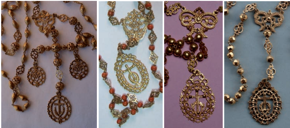
Fig. 83. Rosario. México o Cuba, último tercio del siglo XVIII. Oro calado.