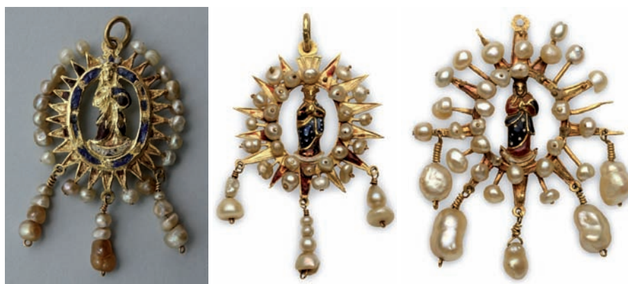
Figs. 66, 67 y 68. Medallas Concepciones, c. 1630. Oro esmaltado y perlas.

Perdidos los ejemplares de la Candelaria, del Pino y otros joyeros marianos del Archipiélago, la pieza de Nuestra Señora del Rosario de Garachico es la de mayor calidad que hemos localizado (figs. 64 y 65). Su diseño en forma de medalla oval calada, con cerco exterior de rayos flameados, al modo de las Concepciones de la virgen de Gracia de Carmona o de la del Louvre 147 , difiere de los modelos más habituales en España con hueco cuadrilobulado o cruciforme, corona y palmas enfrentadas flanqueando la imagen devocional y crestería exterior de lises 148 . Esmaltada en rojo, azul, blanco y verde y acabada por ambas caras, dos hileras de perlas recorren los perfiles de la figura de María, con creciente lunar con las puntas hacia abajo. Han desaparecido las perlas que iban insertas en los extremos de las agujas intercaladas entre los rayos, al igual que los tres pendientes que colgaban de las anillas que remataban los rayos inferiores, tal y como atestigua el acta de entrega que firmó en 1725 la camarera doña Ángela Teresa de Ponte y Llarena 149 .