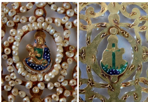
Figs. 60 y 61. Joya de pecho con la Virgen con el Niño. La Palma, c. 1705. Oro, esmaltes y perlas. Anverso y reverso.