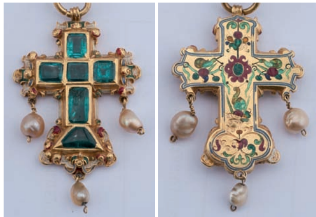
Figs. 25 y 26. Cruz pectoral. ¿Absburgo? siglo XVI. Oro esmaltado, esmeraldas y perlas. Anverso y reverso.

Una variante frecuente de la joyería española y europea del último tercio del siglo XVI y principios del siguiente es la cruz latina, con piedras en cajas de engastes y adornadas con perlas pendientes, las más antiguas con esmaltes excavados al dorso. Transformado en un objeto grande y pesado, este modelo de cruz pectoral, posiblemente originado en Centroeuropa, pasó rápidamente a Indias, donde se consiguen ejemplares semejantes en el tesoro de la virgen de Guadalupe de Sucre o hallados en pecios de navíos. Otros existen en varias colecciones y museos en España y América, algunos de ellos enriquecidos con grandes esmeraldas procedentes de Nueva Granada (Colombia), con el pie formado por otra pentagonal, cuya fecha de ejecución ha sido fijada por L. Arbeteta entre 1610 y 1660 85 . A este tipo de cruz rica , de más que probable origen indiano 86 , corresponden las piezas que la virgen de Candelaria llevaba «al cuello» (según las noticias poseía dos cruces de oro y esmeraldas 87 ), fielmente representadas en sus verdaderos retratos 88 .