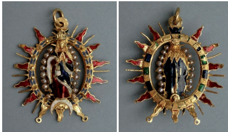
Figs. 64 y 65. Medalla Concepción, c. 1620. Oro esmaltado y perlas.