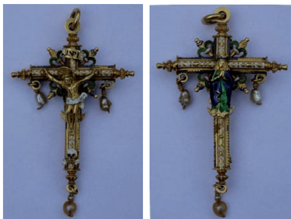
Figs. 27 y 28. Cruz pectoral, c. 1625-1650. Oro esmaltado y perlas. Anverso y reverso.