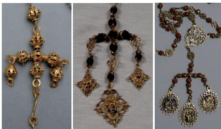
Fig. 71. Rosario, principios del siglo XVII. Oro esmaltado.

Parcialmente conservado, el de la virgen del Rosario de Garachico es el más antiguo que ha llegado hasta nosotros (fig. 71), con cruz griega terminal formada por las mismas cuentas. Huecas y ovoides, están compuestas por dos casquetes calados con ocho hojas o gajos lanceolados esmaltados en verde y blanco, idénticas a la esfera con cruz terminal de la corona imperial remitida de Nueva Granada a la patrona de La Palma después de 1602. De perlas gruesas es un excepcional ejemplar de mediados de esa centuria con siete extremos o paternóster globulares conformados por ocho gajos esmaltados alternativamente en verde y blanco, ofrendado a la misma imagen en 1650 por el navegante Manuel de la Mota al retorno de uno de sus viajes a Cuba y Santo Domingo (fig. 8). Presenta siete dieces de perlas gruesas encadenadas en oro y una cruz con 17 perlas, también gruesas. Carece de la medalla en oro esmaltado guarnecida de perlas con una imagen de Nuestra Señora en el anverso y una cruz en el reverso que pendía de la cruz, desaparecida tras el robo de 1678. Por entonces, la sarta de perlas colgaba de las manos de la virgen, tal y como se ve en las veras efigies pintadas por Juan Manuel de Silva en el siglo siguiente 157 (fig. 3).