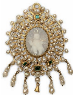
Fig. 47. Medallón-relicario de filigrana, c. 1700-1725. Oro y alabastro policromado.