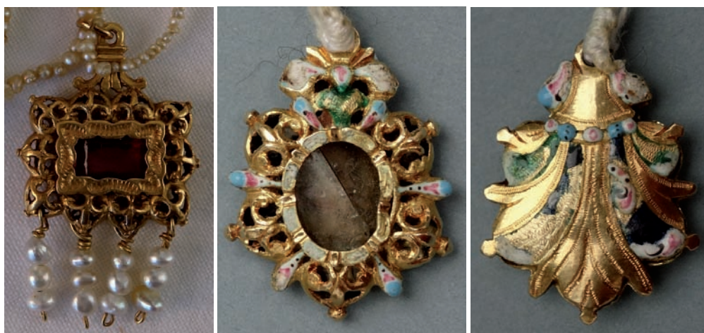
Fig. 42. Relicario, último tercio del siglo XVII. Oro calado y perlas.

Configuración abullonada, con cazoletas huecas y caladas terminadas en pezones , ofrece otra serie de pequeños dijes relicarios a filigranados y retardatarios, del tercio final del siglo XVII o de la primera mitad del Setecientos, de los que se conservan varios ejemplares 118 . Los hay de formato cuadrado (virgen de Gracia en Icod de los Vinos, santuario del Carmen en Los Realejos 119 ) o rectangular de doble ventana y marco interior festoneado (Los Llanos de Aridane 120 , fig. 42) y también elípticos, estos últimos ya de bien entrado el siglo XVIII a juzgar por los esmaltes a la porcelana con el Cordero de Dios al dorso o en forma de cesta con ramillete por el reverso (Nuestra Señora del Rosario de Garachico, figs. 43 y 44), con una única ventana y lazo con anilla superior para su suspensión. La imagen de la Candelaria tuvo una joya de esta clase, descrita como vn relicarito chico de oro quadrado con vna como estampita dentro donado en noviembre de 1762 por doña Antonia Huerta, esposa de don Luis de León. La virgen del Rosario de Icod de los Vinos posee otro pequeño relicario de filigrana oval en forma de roseta pendiente de anilla con dos cadenas.