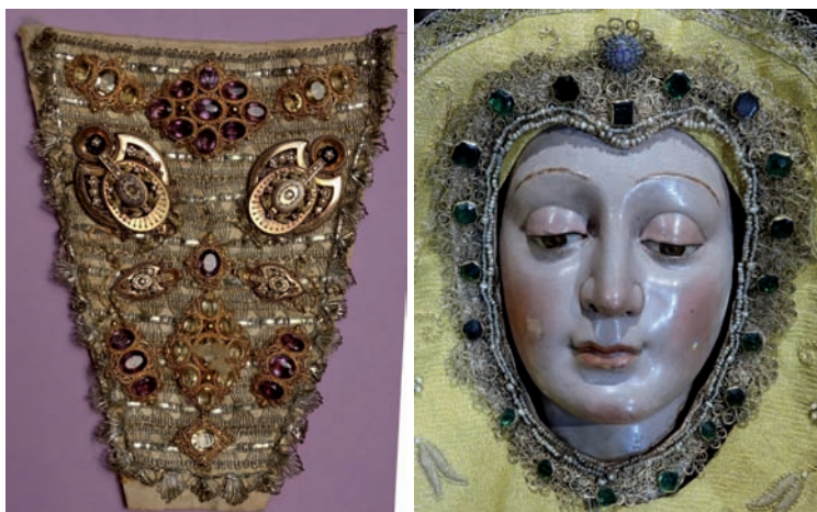
Fig. 14. Peto con joyas inglesas sobrepuestas. Siglo XIX.