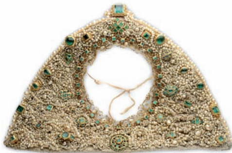
Fig. 13. Rostrillo. Conglomerado compacto de oro, perlas y esmeraldas, fabricado hacia 1770 con numerosos chatones de sortijas, diversas rosas de pecho y un collarite en oro esmaltado alrededor del óvalo de la cara.