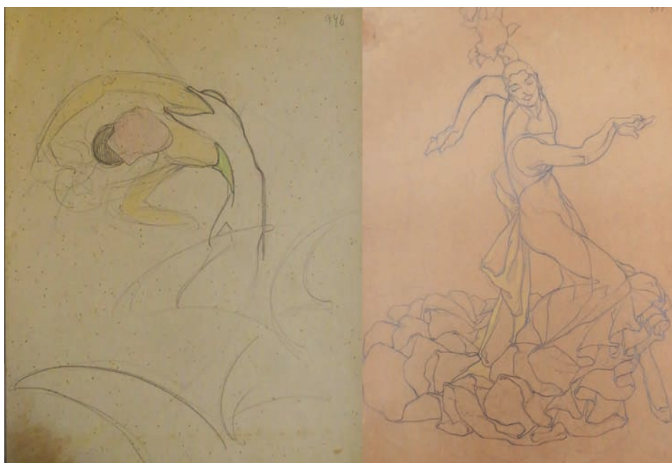
Fig. 6. Estudios de figurín de Soleá para Triana . 1929. Lápiz sobre papel. Izq.: 25 x 32 cm. Dech.: 26 x 42. Fondo Museo Néstor.

Además de las escenografías y figurines que se conservan en el Museo Néstor de este montaje, hemos constatados 18 estudios de figurines, estando convencidos que no son los únicos que Néstor realizó. De todos ellos queremos destacar cuatro del personaje de Soleá [Fig. 6], protagonista de la obra que interpretó “La Argentina”, y dos del cuerpo de baile [Fig. 7]. Lo interesante es que no son solamente estudios de vestuarios, sino también del movimiento, puesto que parece que Néstor intentó captar sus cuerpos en el acto mismo del baile, que puede ser, al mismo tiempo, el punto de partida para la serie Ballet Español , conservada también en los fondos del Museo Néstor, ya que muchos de sus cuerpos se reproducirían en esos lienzos. De modo que su importancia es capital porque se demuestra el interés de nuestro artista por captar lo efímero de la danza, partiendo de su propio recuerdo y de los efectos que sus propios diseños generaban durante los bailes.