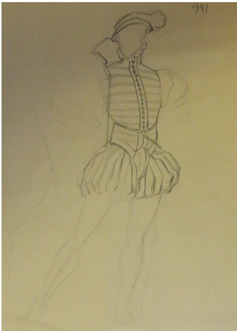
Fig. 12. Estudio de figurín para Don Giovanni. Seconde Costume . 1931. Lápiz sobre papel. 22x 28 cm. Fondo Museo Néstor.

En su última etapa, ya asentado en su ciudad natal, continuaría con el diseño de figurines teatrales, como demuestran muchas de las fotografías y de las críticas que se produjeron tras los estrenos de los espectáculos. Pero de la gran mayoría de ellos no tenemos ninguna constancia artística, pues se conservan tan sólo los figurines referidos a la modernización de la vestimenta tradicional grancanaria que utilizó en sus fiestas tipistas y el estudio de peinados para Una noche romántica (1937), custodiados en el Museo Néstor. En este sentido, en el Archivo de El Museo Canario se encuentra un programa de mano del mencionado espectáculo en el que se reproducen dos figurines, uno masculino y otro femenino sin rostros, como los de Don Giovanni . Lo que conlleva la ampliación de las referencias visuales en cuanto a la creación figurinista de esta etapa en la obra de Néstor 56 .