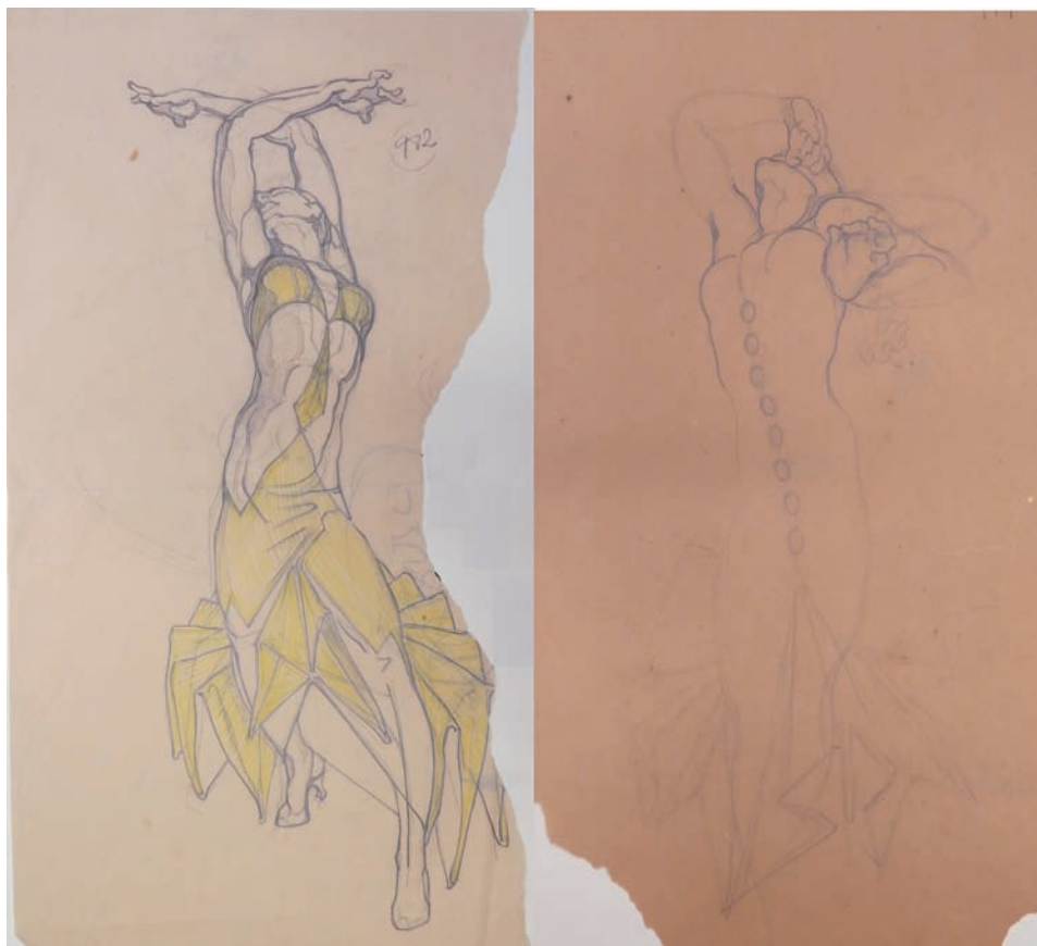
Fig. 7. Estudios de figurín de bailarinas para Triana . 1929. Lápiz sobre papel. 26 x 42. aprox. Fondo Museo Néstor.

Finalizada la etapa de colaboración con esta genial bailarina y coreógrafa, según afirma el propio Pedro Almeida, Néstor tuvo la necesidad de llevar a cabo nuevos encargos laborales para poder sobrevivir en la capital parisina.