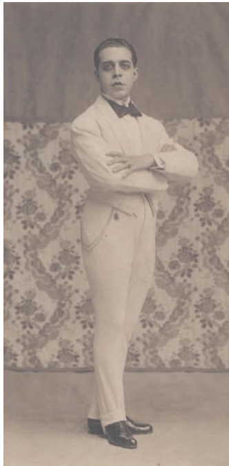
Fig. 1. Fotografía de Néstor Martín-Fernández de la Torre. 1912.

El diseño de escenografías y figurines para espectáculos convirtió a Néstor [Fig. 1] en una de las figuras claves para conocer el proceso de renovación escénica que tuvo lugar en nuestro país durante la llamada Edad de Plata de la cultura española 8 .