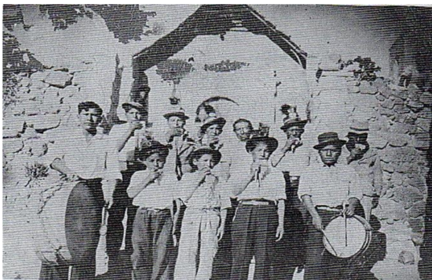
Figura 4: Tropa de Lakitas de Usmagama (Salazar Pincheira. 2002: 58).

Finalmente, Uribe (1963) nos presenta el acompañamiento que realizaban las agrupaciones musicales al baile de denominado Kambas, el cual “...era danza guerrera, con lanzas y flechas. Se acompañaban con bombos y quenás (metálicas)”. (Uribe 1963, 91)