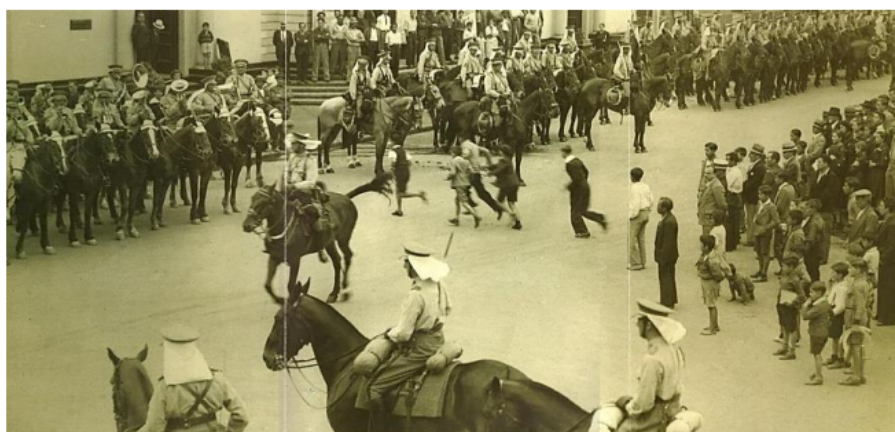
Figura 5: Regimiento de Caballería N°1 “Granaderos” en la plaza de Iquique en 1938. Revista de Historia Militar N°13, 2014: 65-67.

Estos músicos, para establecer vínculos con la sociedad civil, recorrían el puerto de Iquique interpretando diferentes himnos marciales, ejecutando sones en efemérides como el 21 de mayo y la Sociedad de Veteranos del 79, además de la celebración de fiestas patrias, con el fin de generar un ambiente de fervor nacional. Un claro ejemplo de los desfiles se puede apreciar en la figura 5, fotografía tomada en la Plaza Arturo Prat de Iquique, en el frotis del teatro municipal: