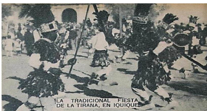
Figura 1: Chunchos saltando al compás de un bombo en “La Tradicional fiesta de La Tirana, en Iquique”. Revista Zig-Zag, 10 de agosto de 1929, en Archivo Histórico Vicente Dagnino (AHVD).

Para la década de 1910, los periódicos de la época realizaban críticas sobre la fiesta, los cuales resaltaban la vestimenta e indumentaria de chunchos quienes eran acompañados por músicos de bombo y platillos (Ver figura 1).