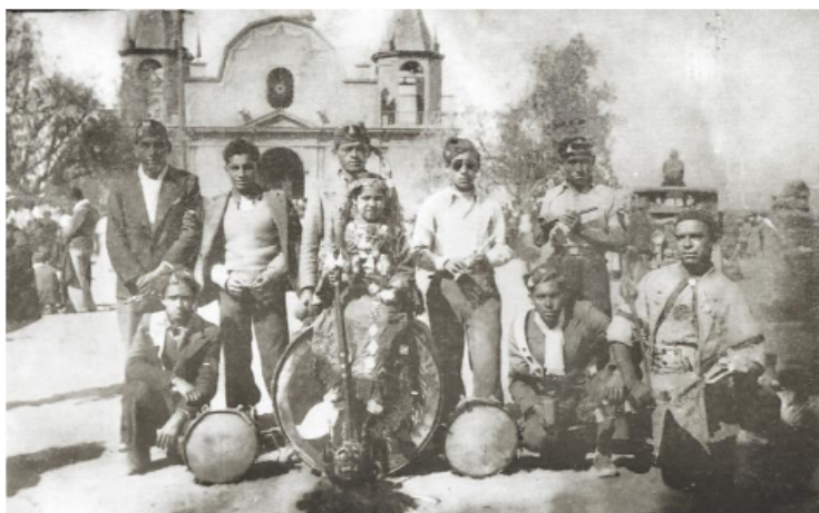
Figura 7: Banda y Baile Piel Roja, La Tirana, 1938. Salazar Pincheira 2004: 69.

Durante periodo de crisis ocurrido en la década de 1930, es donde comienzan a fundarse más bailes religiosos, en especial con la llegada de un nuevo estilo de baile, los “Piel Rojas” (González, 2006), quienes utilizarían instrumentos de percusión para su danzar como lo es el bombo y la caja ejecutando un compás 5/8 (Laan 1993), siendo en algunos casos acompañados por piteros (ver figura 7).