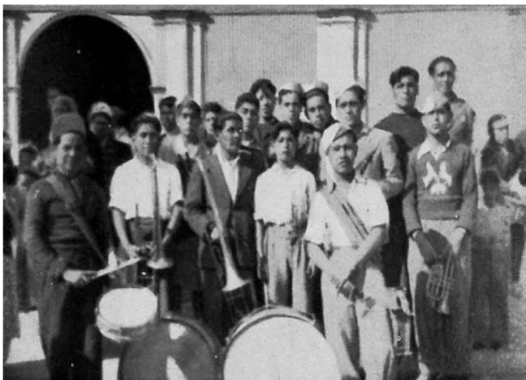
Figura 6: “Banda típica que acompaña a tres o cuatro bailes distintos. (La Tirana, 1947)”. Uribe, Juan. 1963: 88 -89.

Estas agrupaciones podían acompañar a más de un baile religioso pues, las bandas de músicos debían de cumplir con la demanda de la gran cantidad de cofradías conformadas para mediados del siglo XX. Esta práctica es conocida comúnmente como: doblete, si las bandas tocan en dos bailes a la vez; triplete, cuando se acompaña a tres bailes; y así sucesivamente. Como se puede ver en la figura 6 y como describe Uribe (1963), músicos andinos que tocan a tres bailes religiosos, posan con los instrumentos: bombos, caja, trompetas y trombones.