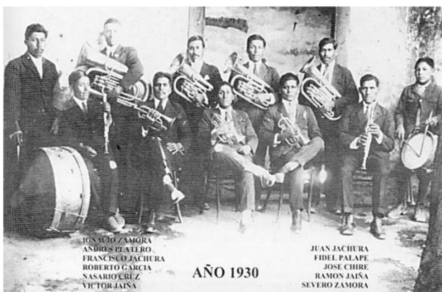
Figura 2: Banda de músicos militares de Guaviña, 1930 (Salazar Pincheira 2002, 45).

Tenían 12 cm de alto por 14 pulgadas de diámetro, (el parche) era de cuero, de cuero de cabro, trabajado elaborado en fábrica... Antiguamente (...) las primeras cajas salían con cordones de tripa de chanco que llegaban de Santiago. Llegaban con el cuero de cabro, venían con tripa de chanco, después nosotros le poníamos cordones de alambre espora que se le llamaba alambre de hilo porque se cortaba la tripa de chanco, así que le empezamos a colocar alambre espora o alambre de mimbre, que era finito (...) (E. Martínez, entrevista, julio 2013)