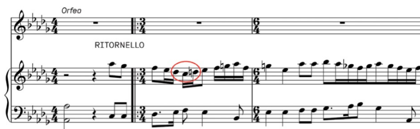
Imagen 9. Vi ricorda, o boschi ombrosi. Claudio Monteverdi.

Segundo ejemplo: Suite II en Fa Mayor HWV 427 (1717) de Georg Friedrich Händel.