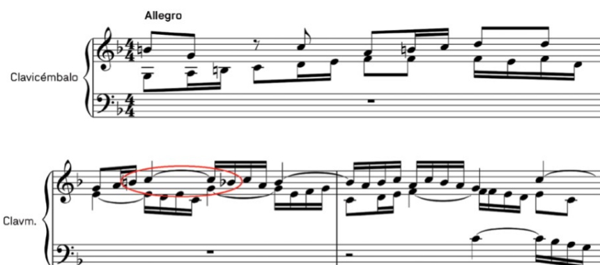
Imagen 10. Suite II en Fa Mayor, HWV 427. Georg Friedrich Händel (1685-1759).