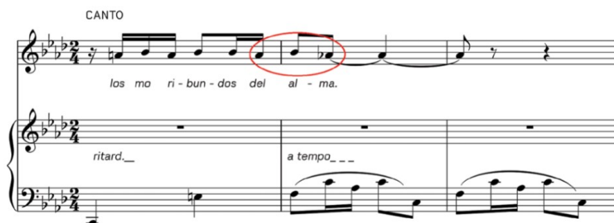
Imagen 13. Canción al árbol del olvido. Alberto Gnastera.

Ejemplo: Canción al árbol del olvido (compas n° 11) de Alberto Ginastera (1916 – 1983).