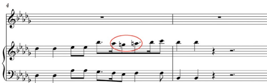
Imagen 9. Vi ricorda, o boschi ombrosi. Claudio Monteverdi.