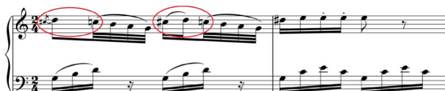
Imagen 3. Sonata en Do mayor k330. Mozart.

Análisis armónico: V con 5ª menor / V con 4ta