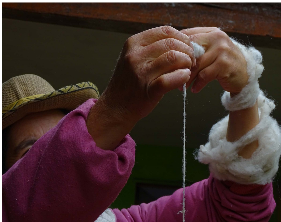
Imagen 3. Ángela González Rodríguez (2022). Cuerpo vivo.

[...] la singularidad, la coordinación y los quiebres del con- senso busca preguntar y desarticular los puntos fijados por las subjetividades, visiones hegemónicas y dogmatismos pre- valentes que limitan los centros de creatividad. La creatividad requiere líneas de fuga, contradicciones, colapsos en aquello que aún no tiene sentido, que sólo puede ocurrir cuando existen aperturas a las más diversas dimensiones del recono- cimiento del otro. (Guattari, 1994)