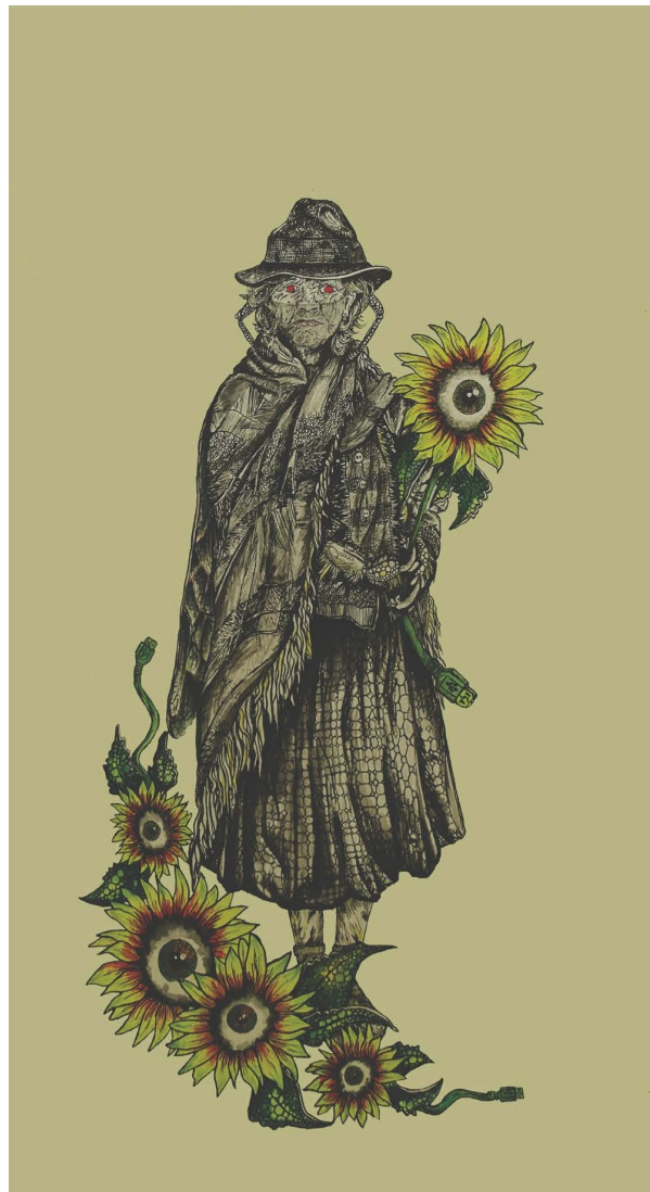
Imagen 4. Andrea Díaz (2022). Señora abeja.

Analizar procesos a partir de los vínculos sociedad-territorios que se producen desde las artes visuales parte de la hipótesis de que las artes construyen estrategias de sentido que permiten asimilar un escenario en construcción, tal como se propone en los procesos creativos: