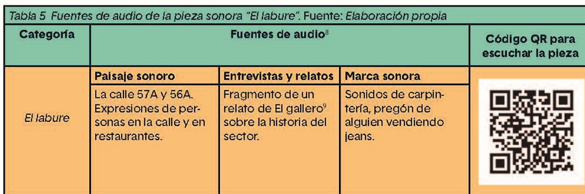
Tabla 5. Fuentes de audio de la pieza sonora "El labure"

La pieza inicia con el paisaje sonoro de calle 57A y 56A, gradualmente se van integrando las Steel Bells y los sonidos de carpintería. Inicia un patrón rítmico con los instrumentos de percusión digitales para dar paso al sonido del pad, el cual va configurando un crecimiento gradual para dar ingreso a la primera expresión: "Una moneda para que el pueblo se vuelva más pobre" , esta expresión es manipulada digitalmente con diversos procesos de transposición en diferentes texturas con voces. Luego, se vuelve a la idea de la primera parte para dar paso a la siguiente expresión: "Le tenemos pasteles con pollo y arepa con huevo" . Esta expresión también es editada con diversos recursos de transporte y filtro. Se retoma el sonido del inicio para dar paso a la expresión "Jeans en promoción" , con esta expresión se hacen cortes para configurar una textura rítmica acompañada de los instrumentos digitales. Después, viene una configuración rítmica a partir de la percusión digital y los sonidos de carpintería. Luego de un corte, con los pads se establece un fondo y con la percusión una base rítmica para dar soporte a la expresión "Johana a cómo está el plato de sancocho, —a tres mil quinientos" . Esta expresión también tiene cortes que configuran una textura rítmica. Luego se retoma el paisaje sonoro inicial de la calle 57Ay 56A, junto con el sonido de la carpintería. Esto se acompaña con los instrumentos digitales para exponer al final un fragmento de una entrevista realizada al Gallero.