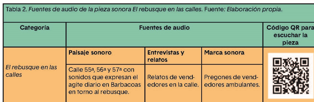
Tabla 2. Fuentes de audio de la pieza sonora “El rebusque en las calles”