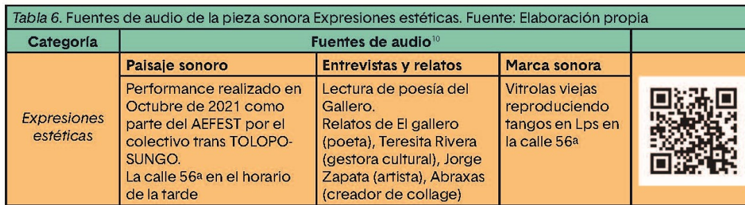
Tabla 6. Fuentes de audio de la pieza sonora “Expresiones estéticas”