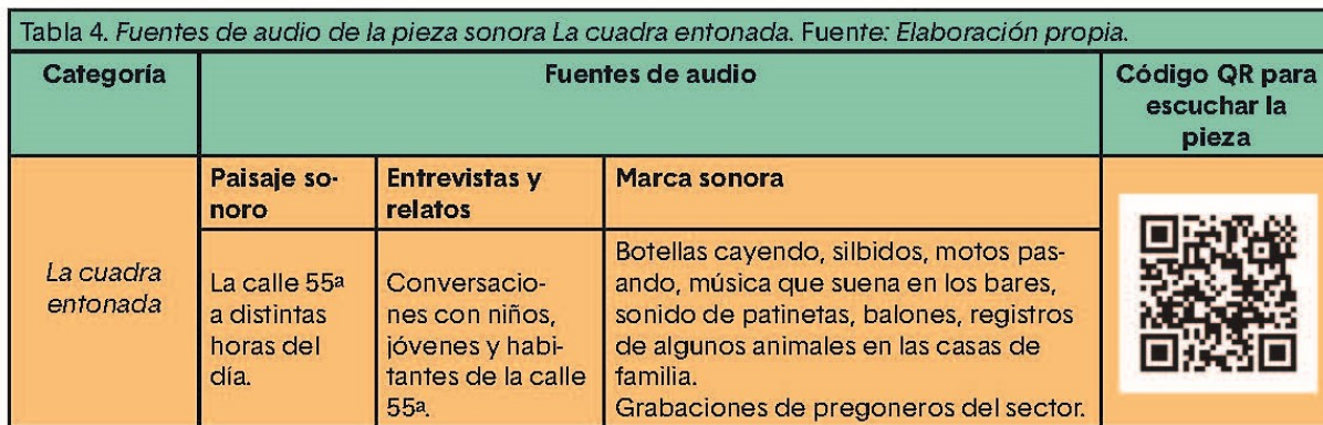
Tabla 4. Fuentes de audio de la pieza sonora “La cuadra entonada”

Cada sonido fue fragmentado en pequeñas partes con las cuales se generaban juegos rítmicos con sonidos y palabras. Las partes rítmicas y el bajo de la pieza se realizaron con los mismos insumos de los audios, es decir, que los mismos sonidos sampleados generaron la tímbrica y la parte rítmica de la pieza. Al ser estas capturas sonoridades cotidianas, no llevan ningún proceso de alteración del audio. Esta pieza está basada en la técnica de looping y el sampling combinada con la creación musical de un patrón rítmico dinámico.