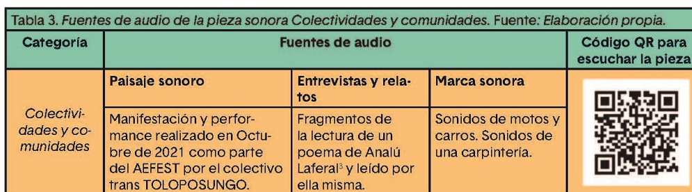
Tabla 3 Fuentes de audio de la pieza sonora “Colectividades y comunidades”

Si bien la categoría inicialmente propuso una representación de la diversidad de colectividades y comunidades que habitan el territorio, el proceso de creación de la pieza llevó a darle prioridad a la comunidad LGTBQ+, intentando reivindicar el derecho a las diversidades sexuales como una forma de resistencia ante la violencia a la que han sido sometidas estas comunidades. Esta es una de las prácticas sociales más representativas del sector de Barbacoas en la ciudad de Medellín.