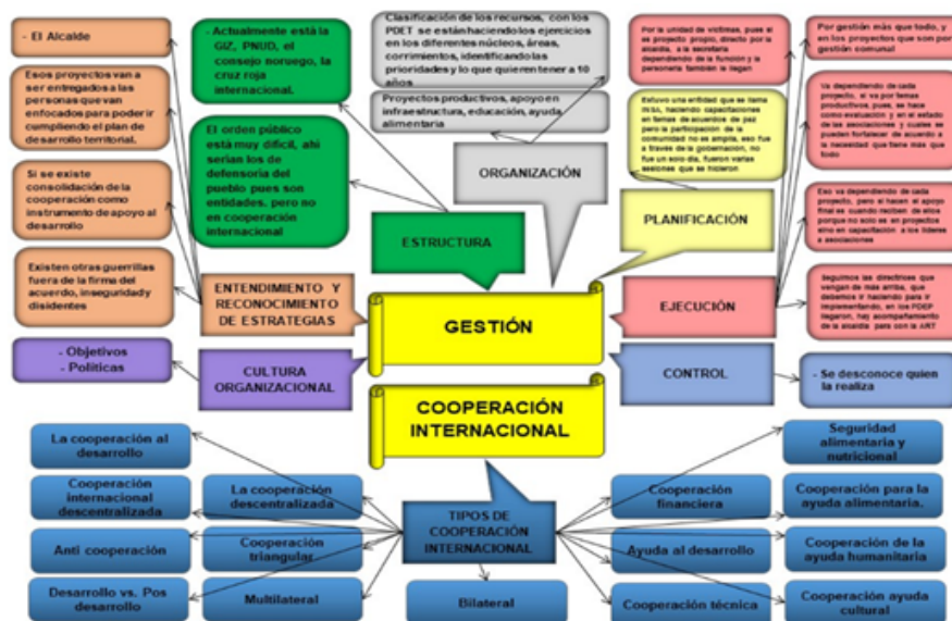
GRÁFICO I. Estructura cognitiva Informante 1 Elaboración propia, (2019).

Ellos como entes territoriales y como autoridad en el municipio, actúan frente a la implementación de los acuerdos de paz firmados con el grupo guerrillero FARC-EP en la Habana Cuba, al respecto en el Gráfico I, el informante 1 indicó que se siguen las directrices que vengan desde los Comandantes, que se deben ir implementando, mientras los Programas de Desarrollo con Enfoque Territorial (PDEP) llegan, también manifestó que hay acompañamiento de la alcaldía para la ayuda humanitaria, alimentaria, cultural, salud y educación, infraestructura, así como proyectos productivos.