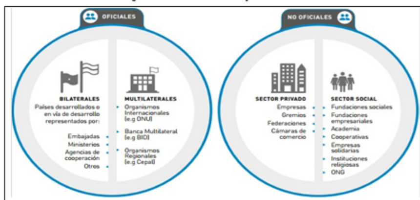
FIGURA I Actores de la cooperación internacional APC Colombia y Fundación ANDI (2016).

Otra característica que agrega Dubois (2013) en definir este tipo de cooperación, es que se canaliza de manera directa entre el donante y el receptor, sin intermediarios. Así mismo, Morales (2007) expone que por medio de esta modalidad se canaliza más del 50% de la ayuda externa, representando exactamente la mitad de la cooperación internacional brindada, encontrándose casi al nivel de la cooperación otorgada por los organismos internacionales, sobrepasándola por una pequeña diferencia.