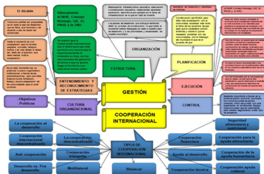
GRÁFICO III. Estructura cognitiva Informante 3 Elaboración propia, (2019).

Respecto al encuentro con el informante 3, cuya información se resume en el Gráfico III, se puede indicar, que el ambiente escogido fue bajo un clima tranquilo, en donde el investigador hizo una introducción expresando el propósito de esa visita dirigida a realizarle una entrevista que le permitiese recopilar información para poder avanzar con el trabajo de investigación en desarrollo, esperando aprovechar al máximo el tiempo y su valiosa experiencia, asociados a los tópicos vinculados con las categorías de la investigación.