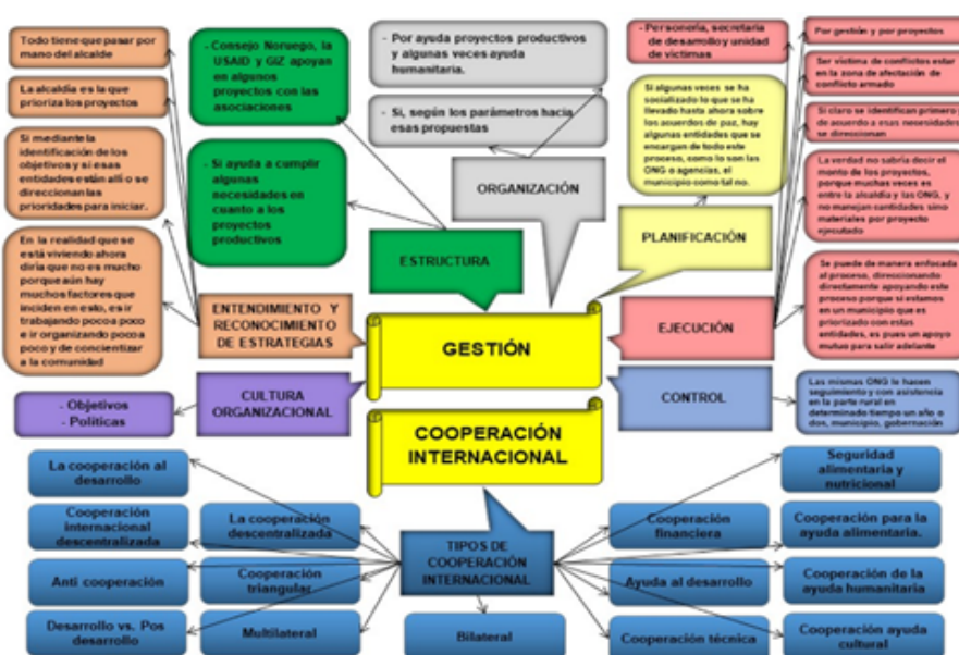
GRÁFICO IV. Estructura cognitiva Informante 4 Elaboración propia (2019)

En este sentido, también se le preguntó quién es el encargado dentro del municipio de aprobar los proyectos de cooperación internacional que están destinados para ser desarrollados dentro de la comunidad, el Alcalde, Personero Municipal, Secretario(a) de Desarrollo, Tesorero(a), Secretaría General, otro, a lo cual respondió que todo debe pasar por mano del alcalde.