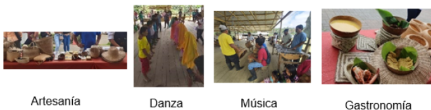
FIGURA III Manifestaciones culturales en Centro San Salvador de la Nacionalidad Chachi Elaboración propia, 2022.

chica de maíz y el perfume, son de consumo gratis, demostrando la fraternidad, el valor comunitario y la sensibilidad, el valor, respeto y cuidado hacia el prójimo.