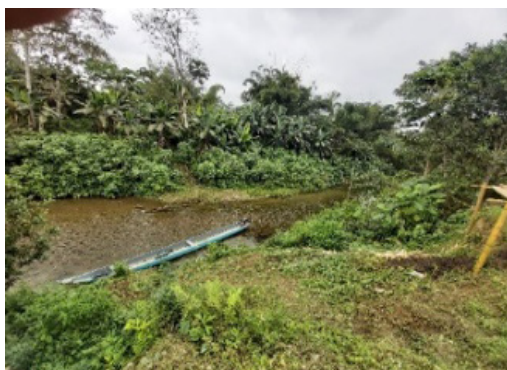
FIGURA II Río Sucio y canoa Chachi Elaboración propia, 2022.

El río Sucio, posee ese nombre debido al transporte de gran cantidad de sedimentos en el periodo de lluvia, y funciona como recurso hídrico que permite desarrollar actividades de transporte, aseo, y pesca deportiva. En el territorio existen varias cascadas, las cuales son de exuberante belleza y permite el disfrute de sus visitantes. El bosque húmedo, permite observar biodiversidad en especies de flora y fauna, donde resalta el árbol de calade, laurel, sande, babasco. En estos recursos se puede practicar actividades de agua, como: Paseo en canoa, pesca deportiva; y terrestre: Montañismo, senderismo, actividades recreativas, caminata, camping, picnic, observación de flora y fauna. Se espera que a corto plazo se ofrezca actividades de aire como: Canopy; y terrestre: Cicloturismo.