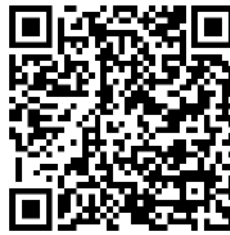
FIGURA IV Video de Comunidad San Salvador de los Chachis Ecuador Delgado (2021c).

Para la jerarquización del área en estudio se logra a través del uso de la ficha, la cual cumple la función de evaluar de manera técnica el Centro San Salvador de la Nacionalidad Chachi, por lo que se describirá y analizará cada criterio de propuesta (ver Figura V).