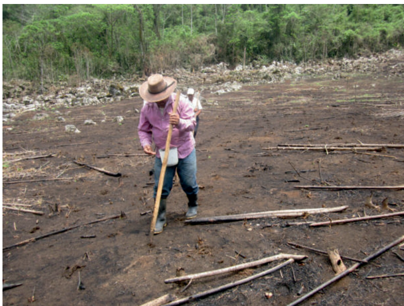
Figura 4. Inicio de siembra de milpa, en la comunidad de Veinte Casas.

Los agricultores de Veinte Casas identificaron que, en el almacenamiento del maíz, el nivel de susceptibilidad de daño varía en dependencia del tipo o variedad de maíz (24%); mientras que el frijol almacenado es resistente o tolerante al ataque de insectos. Fueron precisos al indicar que la semilla del maíz híbrido de generación avanzada incrementa el daño del bakni' ( Sitophilus granarius ), mientras que las variedades locales (olotillo, cruza olotillo-tuxpeño) son más resistentes. Por ello, la mayoría de los agricultores de Veinte Casas siembran más de una variedad en la misma parcela, para satisfacer sus necesidades tolerando la presencia del insecto. En el ciclo de temporal se prefieren las variedades locales y en el de tornamil los híbridos de generación avanzada, porque son menos resistentes a las lluvias. El combinar los diferentes tipos de semilla de maíz en una misma parcela les permite obtener cosechas en distintos tiempos, ya que los híbridos se cosechan en cuatro meses y las variedades locales hasta los seis meses (Figura 4). Ante este conocimiento, es altamente recomendable que desde las autoridades de la REBISO se promueva la conservación de semillas criollas, así como el cultivo de diferentes variedades de maíz en una misma milpa.