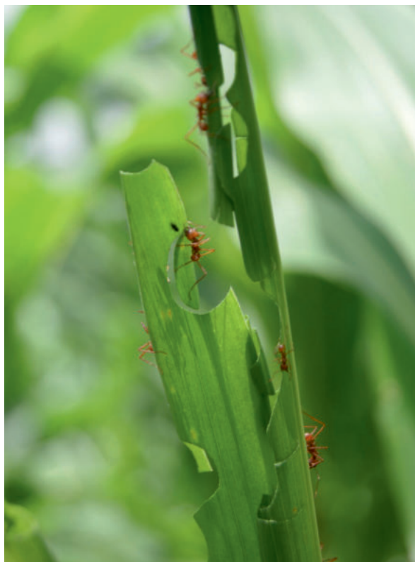
Figura 3. K'is ( Atta mexicana ) presente en planta de maíz, en la comunidad de Veinte Casas, 2016.

insectos con base en su importancia, ya sea como perjudicial para sus cultivos o por ser fuente de alimento (Bentley, 1990; Costa-Neto, 2002).