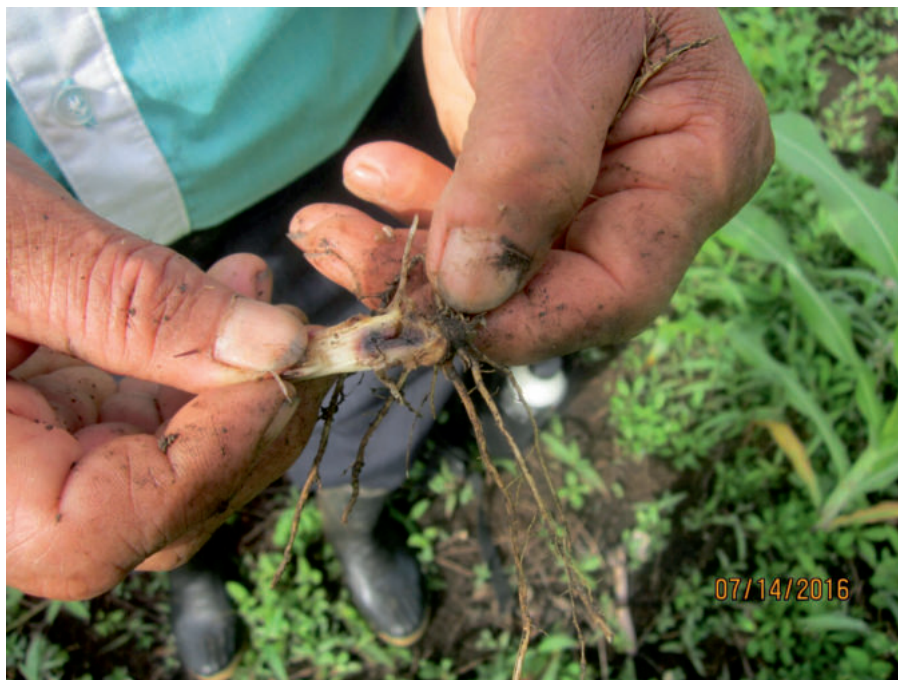
Figura 2. Recolecta de akanchon ( Diatraea sp) en tallo de maíz, en la comunidad de NVSJCH..

organismos observados, por pequeños que sean, ya que con ellas se forma el conocimiento, en este caso la construcción de su representación a través de la nomenclatura, socialmente aceptada y compartida (Pont Suárez, 2010) (Figura 2).