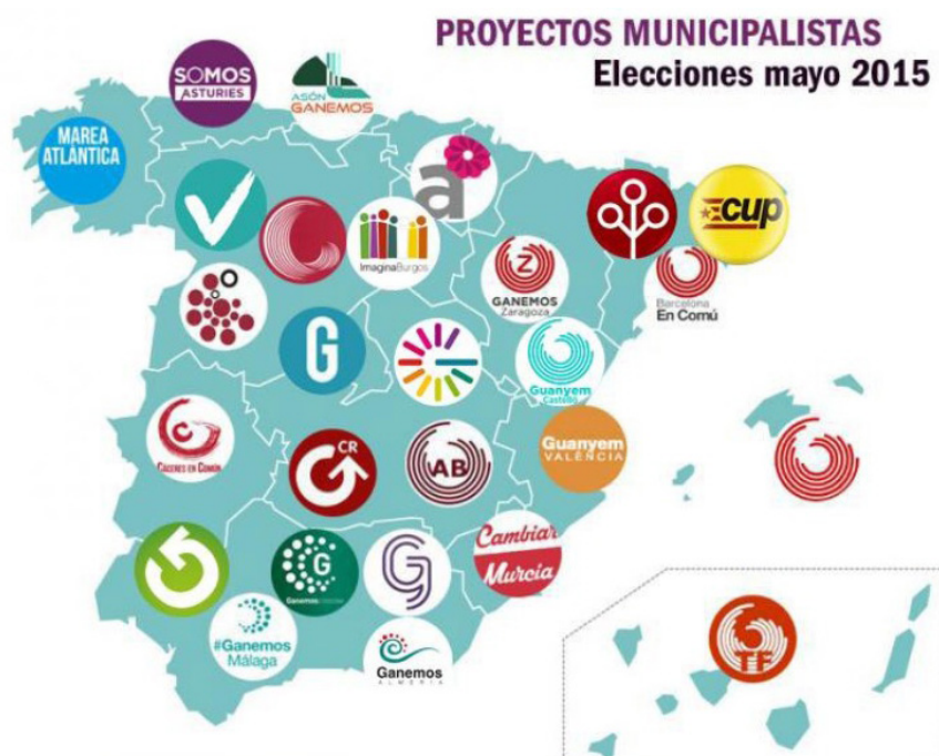
GRÁFICO 1. CANDIDATURAS MUNICIPALISTAS PRESENTADAS EN LAS ELECCIONES MUNICIPALES DE MAYO DE 2015