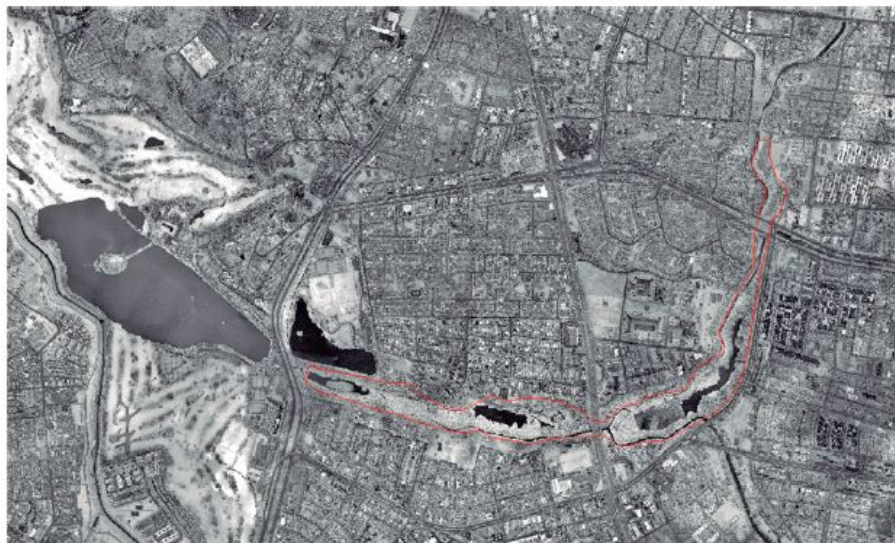
Figura 2. Imagen Infrarrojo del Humedal Córdoba.

El caso del humedal de Córdoba, ubicado en el noroccidente de la ciudad, en la localidad de Suba, es un ejemplo de la acelerada fragmentación de estos ecosistemas. En la actualidad se encuentra dividido en tres fragmentos, debido al paso de las avenidas Córdoba, Suba y Boyacá. El humedal está inmerso en una matriz urbana que condiciona de forma directa sus procesos ecológicos y su extensión superficial (figura 2). Este humedal contribuye al sistema hídrico de la ciudad, al ser un cuerpo amortiguador natural de crecientes, pues hace parte de la cuenca del Salitre, que, junto con los ríos Fucha y Tunjuelo, drena el agua de más del 90% del área urbanizada actual. La cuenca del río Salitre se encuentra ubicada en el sector centronorte de la ciudad, limita por el norte con la cuenca del río Torca y el humedal La Conejera, por el occidente con el río Bogotá y el humedal Jaboque, por el oriente con los municipios de La Calera y Choachí, y por el sur con la cuenca del río Fucha (SDA 2015).