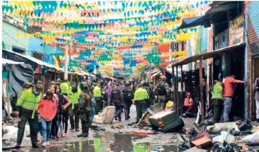
Figura 3 Construcciones informales en el Bronx.

Tal como se ha mencionado, con la destrucción física de la Calle del Cartucho muchos de sus habitantes migran manzanas abajo hacia lo que se conocería como la Calle del Bronx. Es decir que la intervención pública urbanística no produjo más que la expansión de la situación social y sus imaginarios a otros sectores, junto con el crimen y la configuración de la marginalidad y las expresiones de injusticias socioespaciales que se habían configurado en el nicho de los años ochenta. Vargas y Martínez (2013) afirman que para el estudio de la Calle del Bronx es posible aproximarse de dos formas: desde el microtráfico y la indigencia.