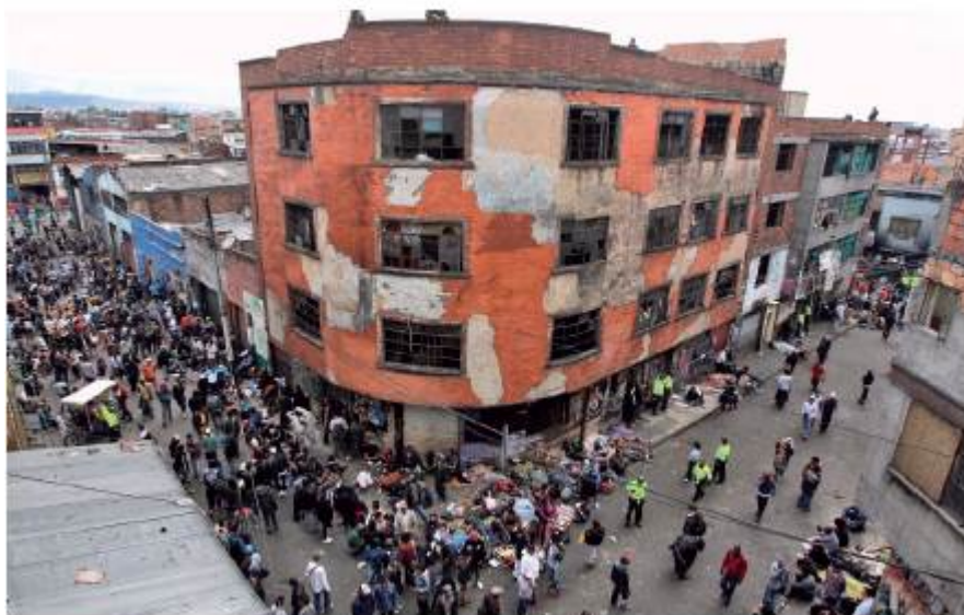
Figura 2 Edificio desgastado en el Bronx.

En ese sentido, la Calle del Bronx se constituyó como una combinación de las categorías mencionadas: estructuras urbanas en malas condiciones (Figura 2); terrenos invadidos por habitantes de calle; infraestructura construida con materiales precarios que se alzaba sobre las aceras con el fin de brindarles a los consumidores de droga un refugio temporal (Figuras 2 y 3); altas tasas de homicidios y robos a mano armada. Se consolidó el entrecruzamiento de fenómenos e historias, como si fuese una repetición del Cartucho, para generar de esta manera un espacio de miedo cuyo "reconocimiento" era de carácter colectivo, es decir, una toporrepresentación profundamente nefasta.