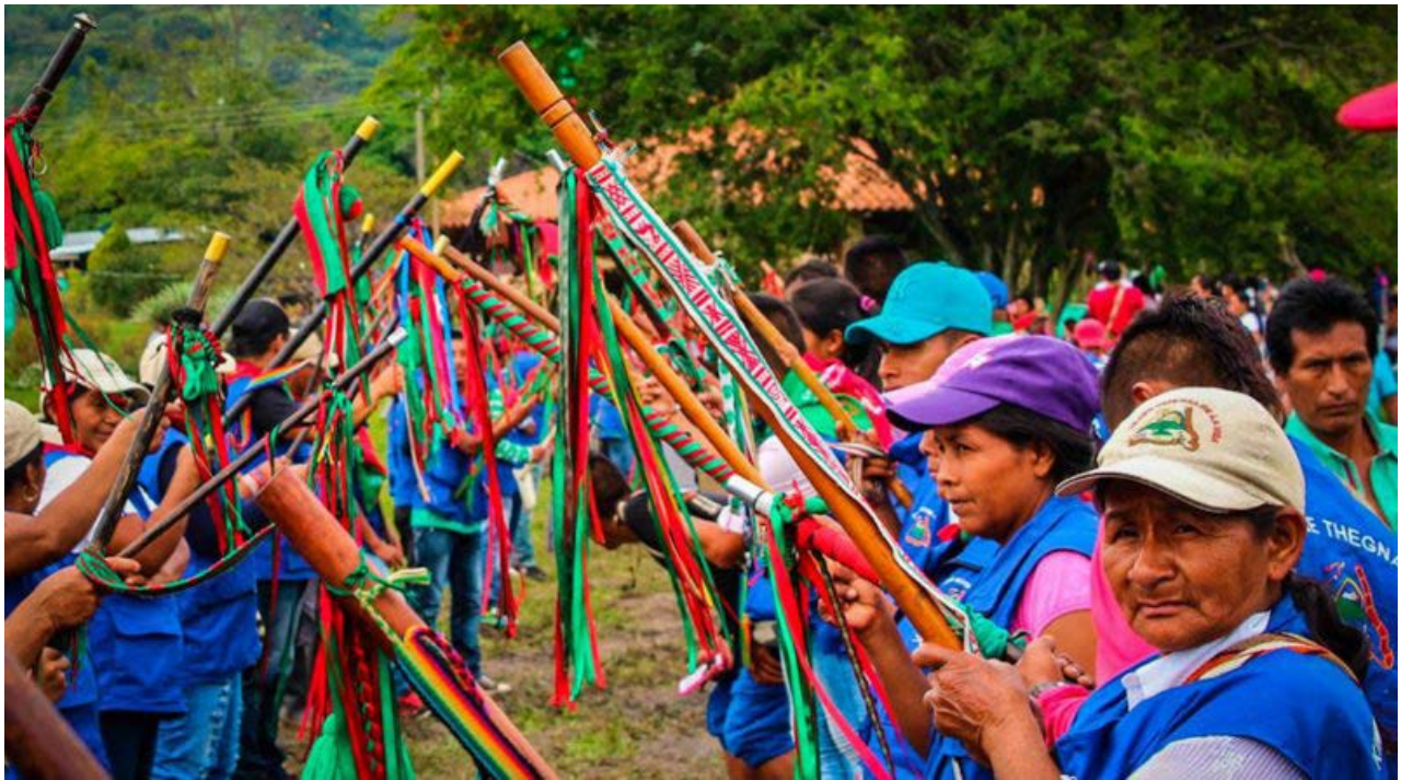
Figura 4. Guardia indígena de la Asociación de Cabildos Indígenas del Norte del Cauca (ACIN).

negras históricas de la Costa Pacífica para 2006 (Chaves y Zambrano 2006, 9). Aunque esto fue un gran logro, estas regiones siguen siendo marginadas económicamente, con tasas de pobreza y analfabetismo dramáticamente más altas, muchos menos hogares con electricidad y agua corriente y pocas carreteras y servicios públicos en general. Como indica Oslender (2002), aunque la nueva Constitución ofreció inclusión discursiva y derechos territoriales, estos grupos enfrentan a una continua exclusión socioeconómica y política. Estas regiones han sido las más afectadas por la guerra. Los imaginarios de la tropicalidad se han militarizado. Las barbaridades se hacen en esos espacios imaginados como bárbaros. Los actores armados utilizan imaginarios de raza y lugar para invisibilizar sus actos de violencia en lugares guionizados como violentos (Vergara 2017; Alves 2019; Cárdenas et ál. 2020). Como dice Carlos Rosero, líder del Proceso de Comunidades Negras, la discriminación racial se expresa a través de la guerra y la guerra está racializada (comunicación personal, 25 de abril de 2011).