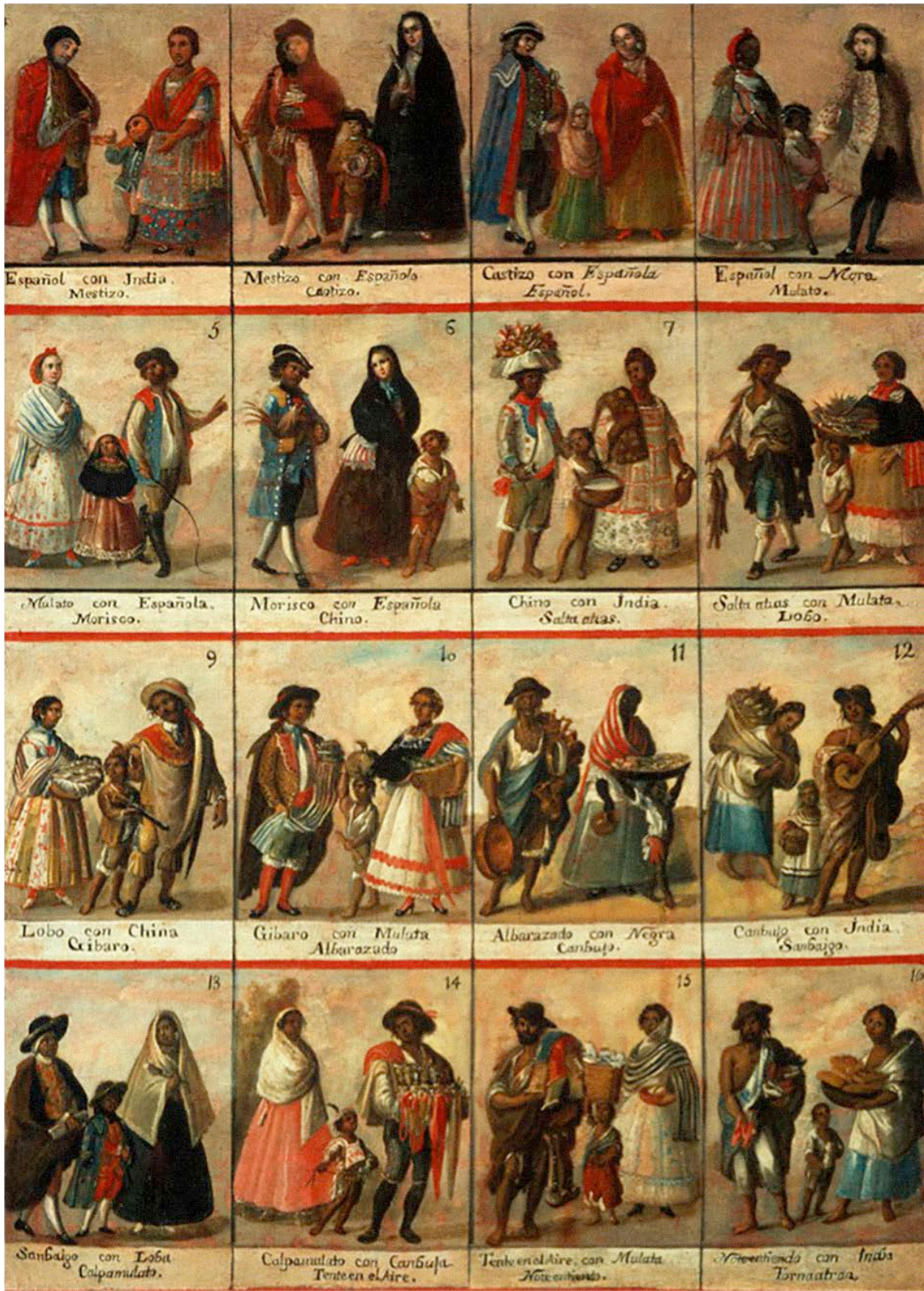
Figura 1. Cuadro anónimo de castas mexicanas del siglo XVIII. Fuente: Artista desconocido (s.f.a).