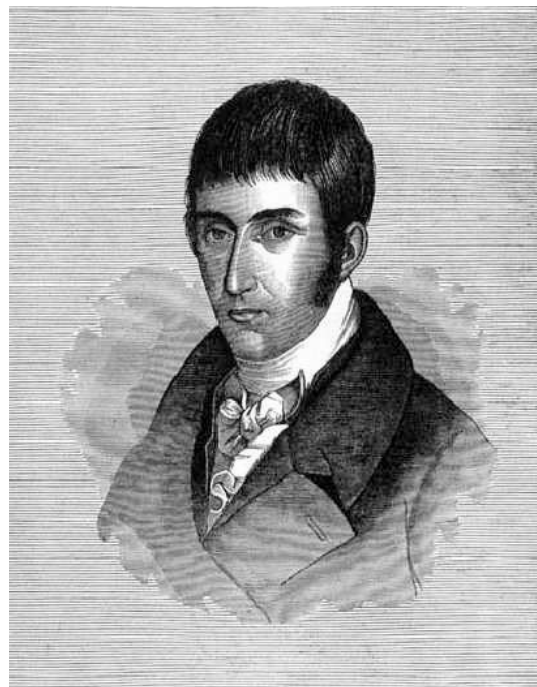
Figura 3. Francisco José de Caldas.

cuando este ángulo [facial] crece, crecen todos los órganos destinados a poner en ejercicio la inteligencia y la razón; cuando disminuye, disminuyen también estas facultades. El europeo tiene 85° y el africano 70°. ¡Qué diferencia entre estas dos razas del género humano! Las artes, las ciencias, la humanidad, el imperio de la tierra son patrimonio del primero; la estolidez, la barbarie y la ignorancia son las dotes de la segunda. El clima ha formado este ángulo importante. Es el clima el que ha dilatado o comprimido el cráneo, ha también dilatado y comprimido las facultades del alma y la moral. (Citado en Múnera 2005, 75)