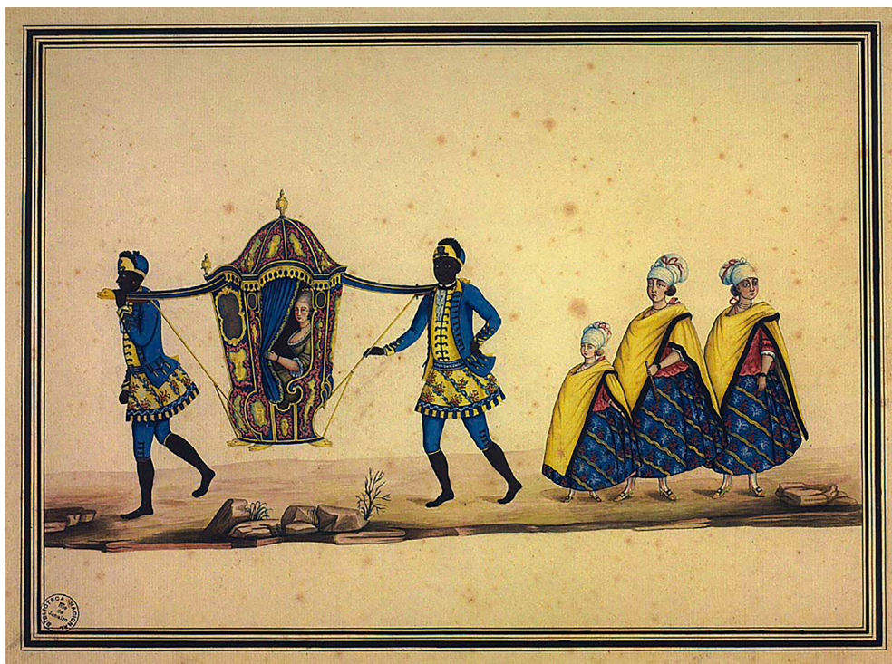
Cadeira de arruar por Carlos Julião [17--?]. Disponível em: < http://bndigital.bn.gov.br/projetos/escravos/galeriadesenho.html >. Acesso em: 15 set. 2019.