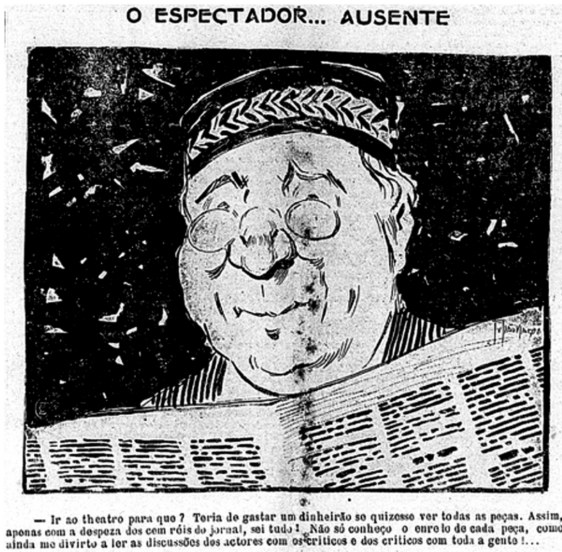
Figura 3 "O espectador... ausente." [Ilustração], O Paiz , 14/06/1916