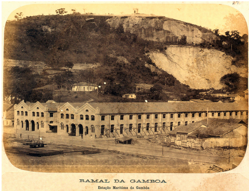
Figura 4 Armazéns da Estação Marítima da Gamboa (1881)