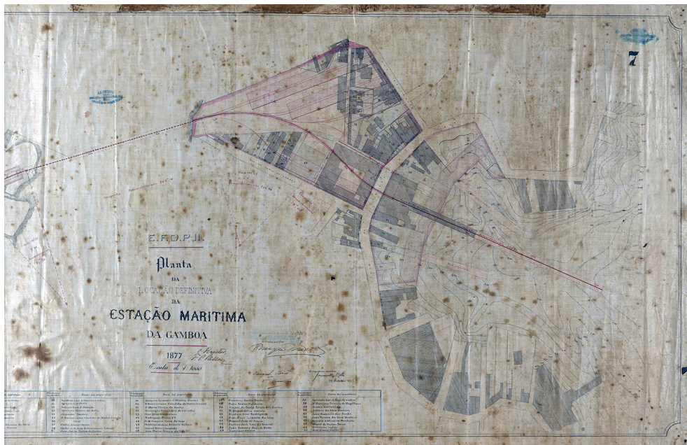
Figura 2 Recorte da Planta [Projeto] da Estação Marítima da Gamboa (1877)