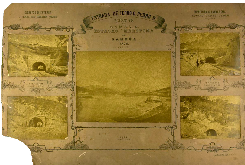
Figura 3 Estrada de Ferro D. Pedro II – Vistas do Ramal e Estação Marítima da Gambôa (1879)