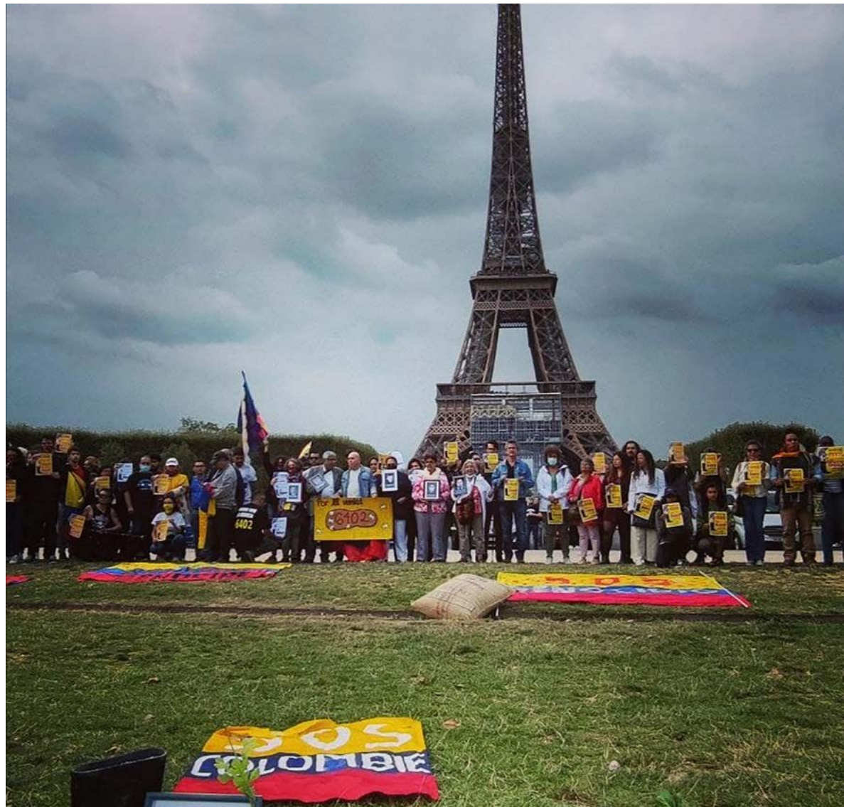
Fig. 7. París, Francia. Campaña por la verdad. 2019.