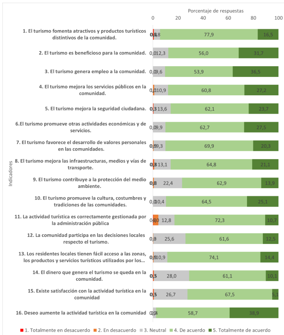
Gráfico 1. Porcentajes de las respuestas según escalas e indicadores